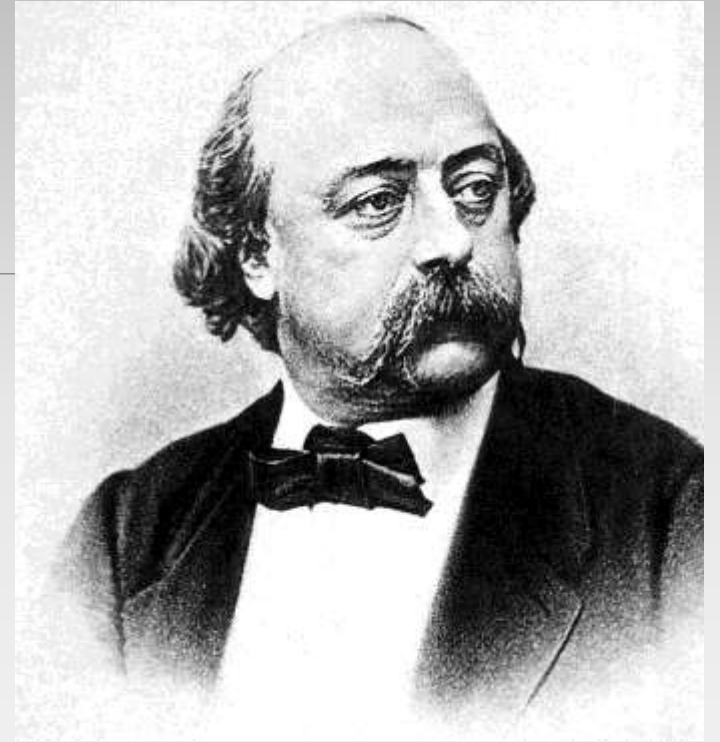
Флобер Гюстав 1821 - 1880

«Гобсек» (1830г.), «Отец Горио» (1834г.).