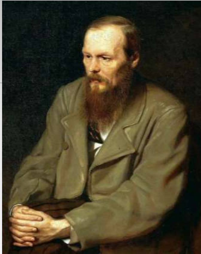
Достоевский Федор Михайлович 1821 - 1881

«Повести Белкина» (1830г.), «Пиковая дама» (1834г.), «Капитанская дочка» (1836г.).