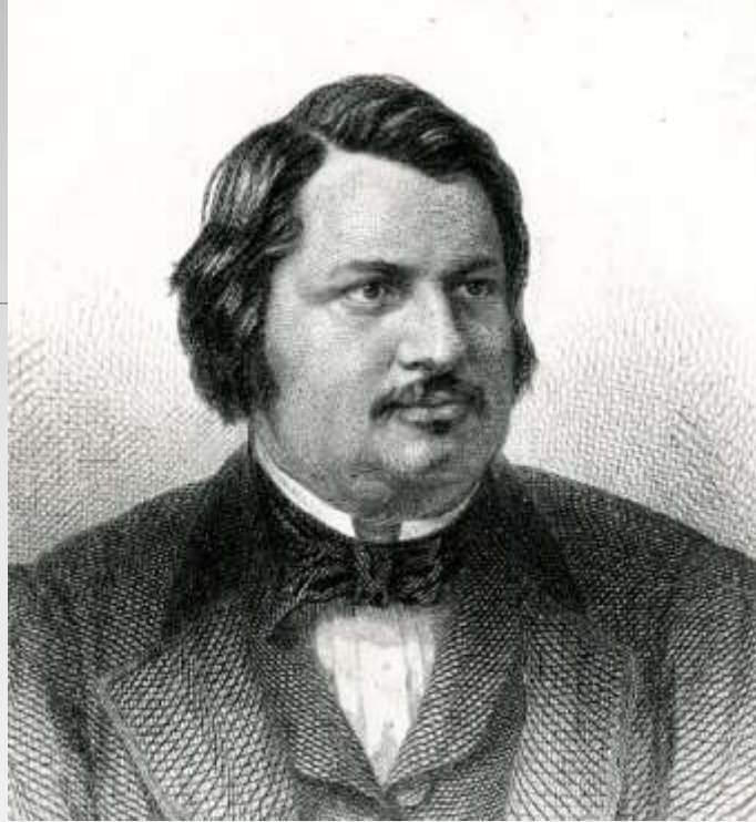
Оноре де Бальзак 1799 - 1850

«Двойная ошибка» (1833г.), «Души чистилища» (1834г.), «Кармен» (1845г.).