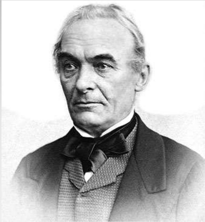
Проспер Мериме 1803 - 1870