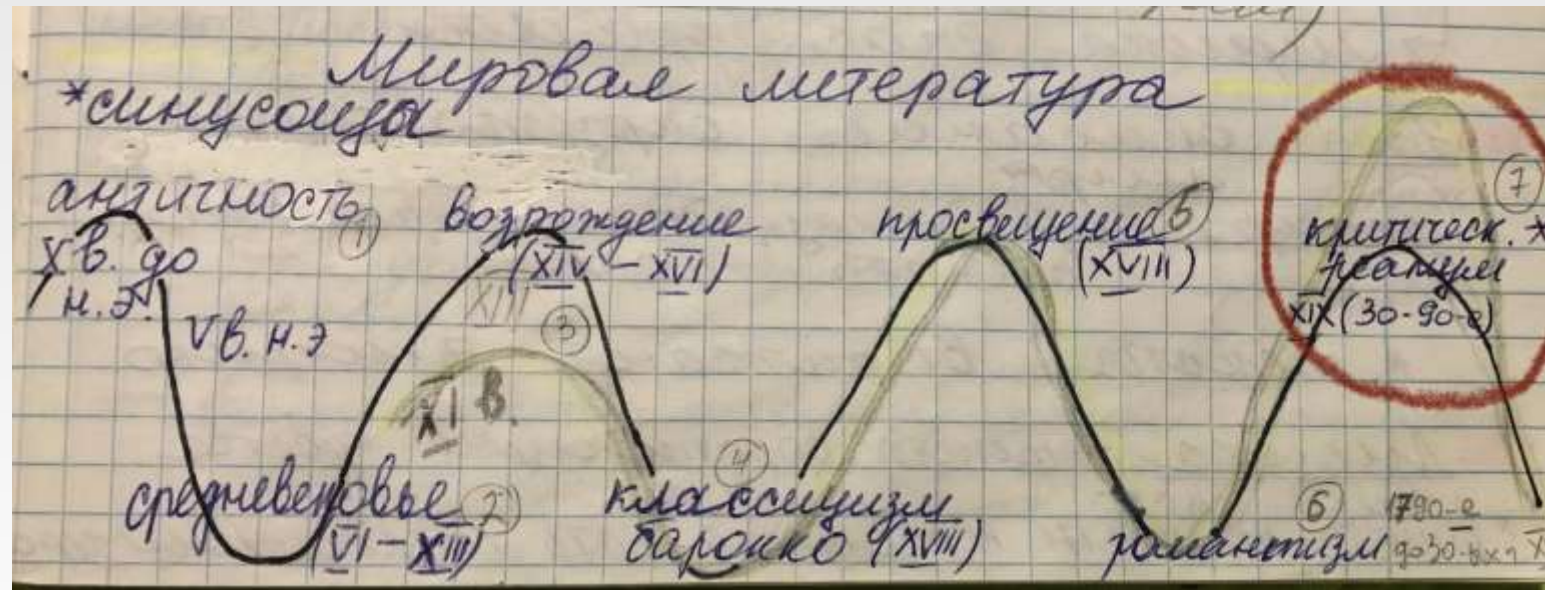
Маятник литературных стилей в мировой литературе

Если рассматривать критический реализм как часть условной синусоиды литературных периодов, то он представляет собой «подъем»