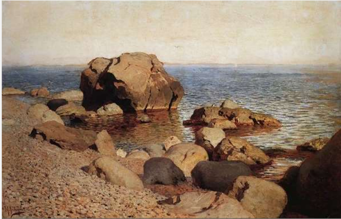
Берег моря. Крым, 1886 г.