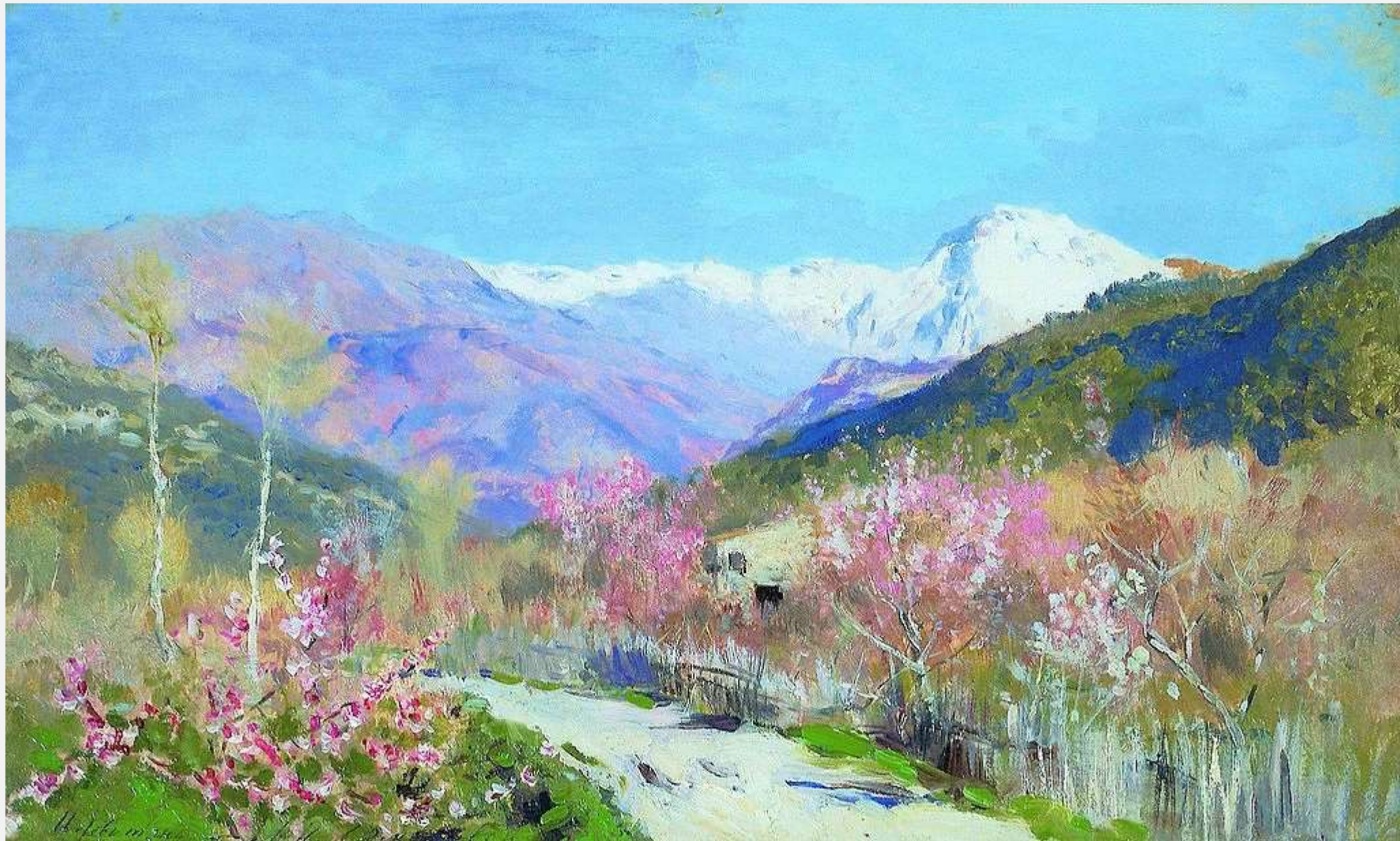
Весна в Италии, 1890