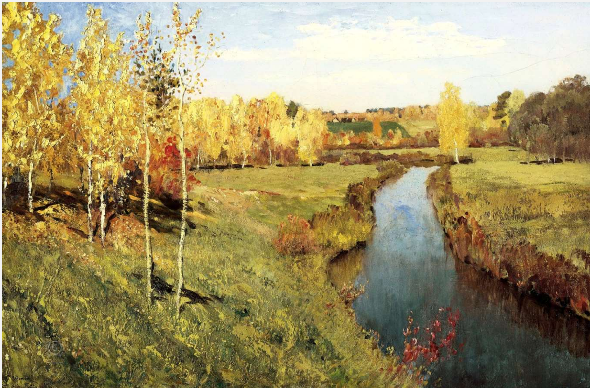
Золотая осень, 1895