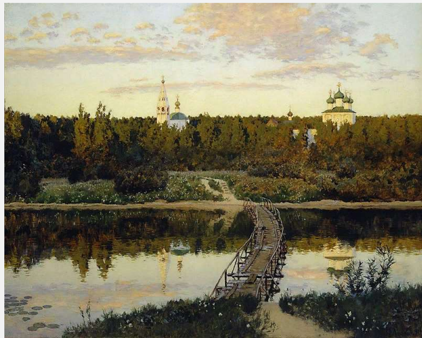
Тихая обитель, 1890 г.