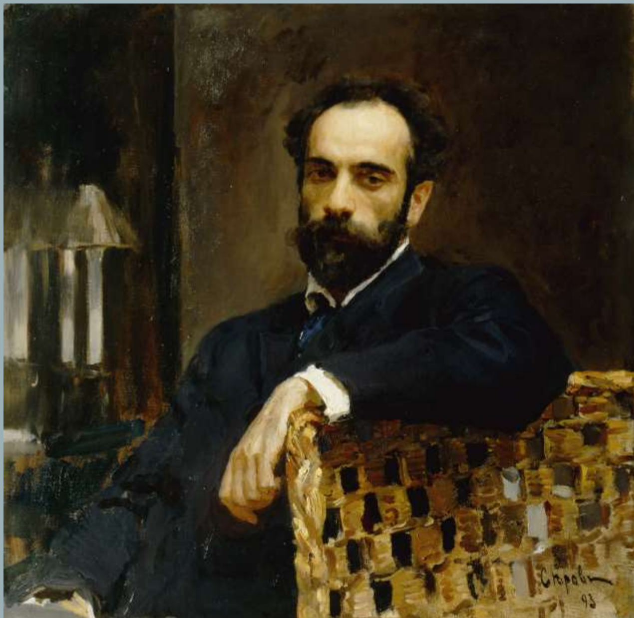
Серов В.А. Портрет И.И. Левитана. 1893