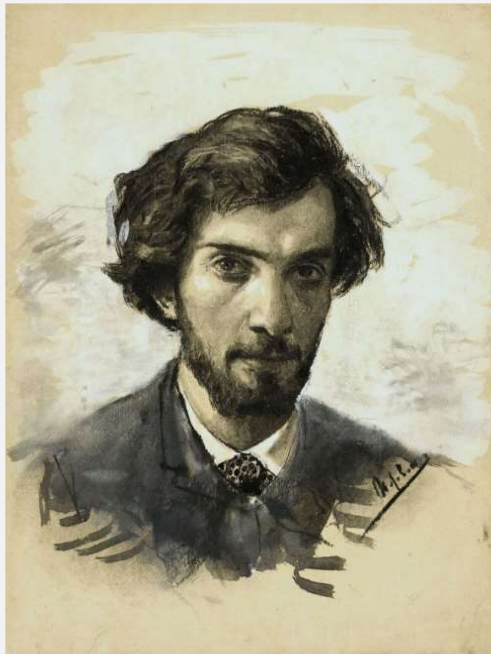
«Автопортрет», 1885 г.