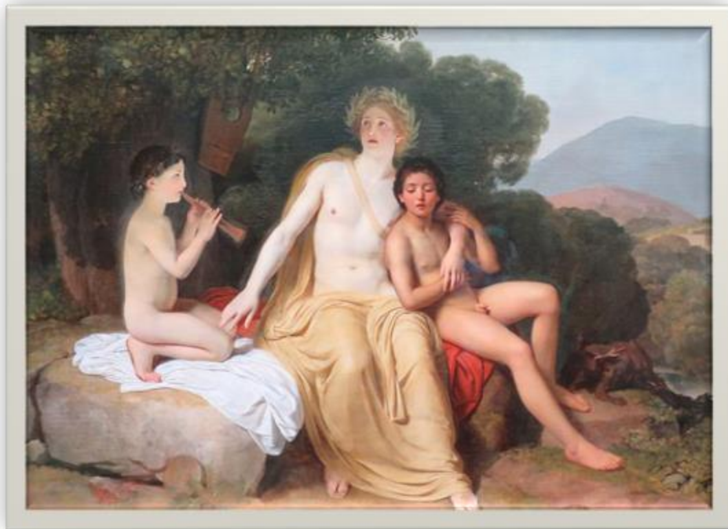
«Аполлон, Гиацинт и Кипарис, занимающиеся музыкой и пением» (1831-1834)

Его последние академические работы претворяют эстетику романтизма. А. Иванов поднимает в своих картинах исторические темы, рассказывает о судьбоносных событиях и легендарных героях.