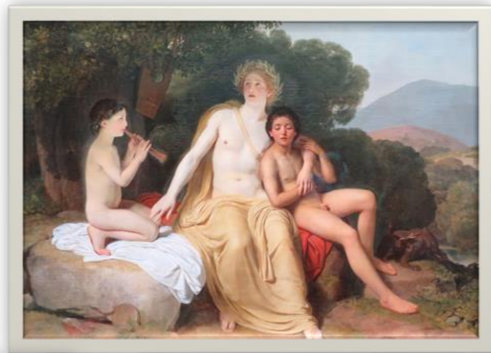
«Аполлон, Гиацинт и Кипарис, занимающиеся музыкой и пением» (1831-1834)

В продолжении академического образования А. Иванов был награжден поездкой за границу. В 1830 году он поехал в Европу изучать творчество знаменитых мастеров, жить и заниматься творчеством. Он много путешествовал по разным городам, но решил остаться в Италии.