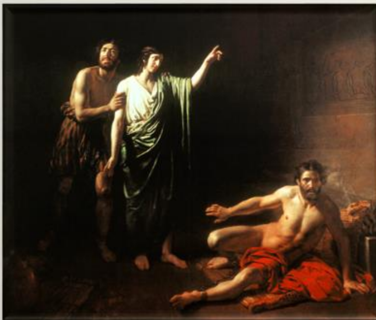
«Иосиф, толкующий сны заключенным с ним в темнице виночерпию и хлебодару», 1827