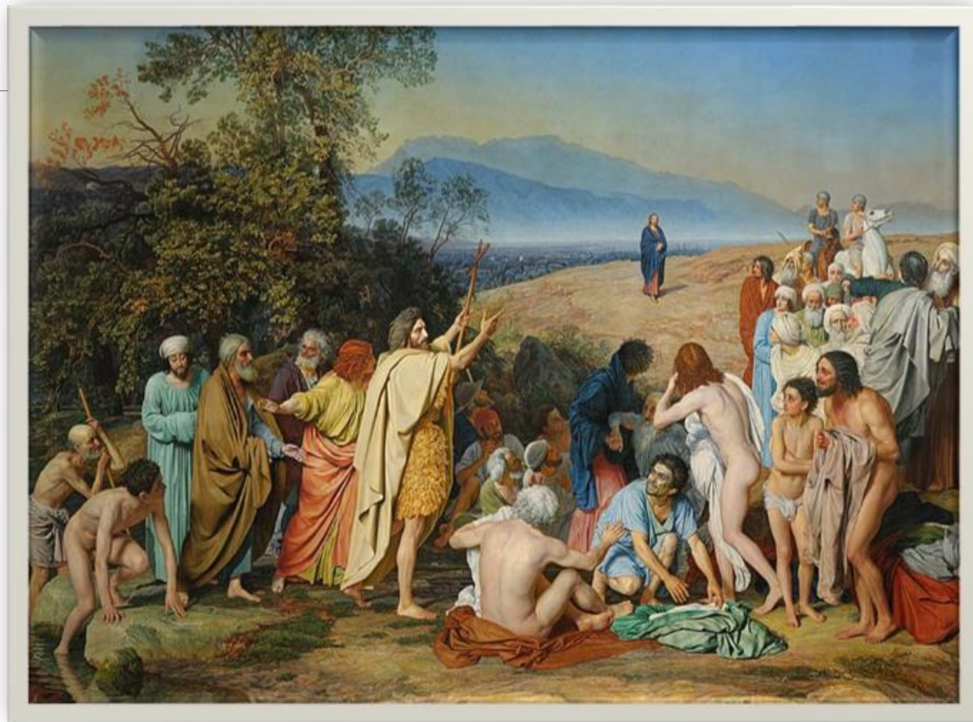
«Явление Христа народу» (1837–1857)

Сознание А. Иванова находилось тогда на пике новейших философских идей современности.