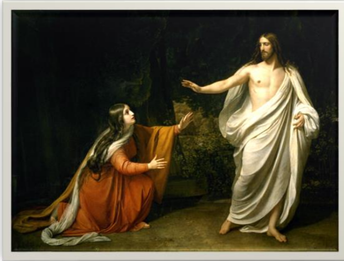
Явление Христа Марии Магдалине после воскресения, 1835

Главная его задача - постижение истинной природы человека, изучению которой он посвящал десятилетия жизни и творчества. Огромный интерес представляет галерея этюдов, сделанная к картине – фундаментальная подача отображения мира.