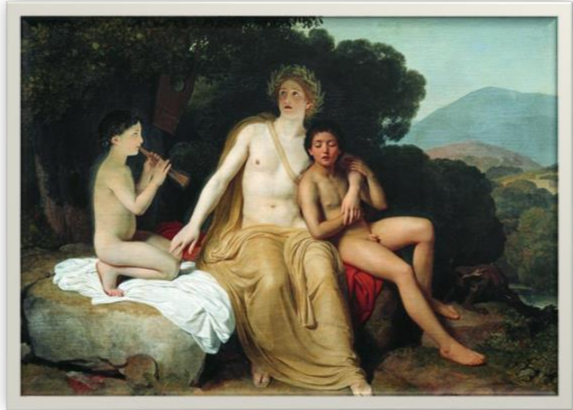
«Аполлон, Гиацинт и Кипарис, занимающиеся музыкой и пением» (1831-1834)

Сам художник, разочарованный в своей концепции, принимая ее утопичность, оставляет ее незавершенной.