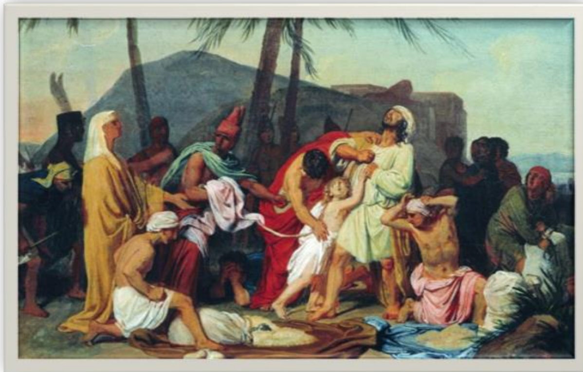
Братья Иосифа находят чашу в мешке Вениамина, 1833

Уже находясь в Европе, художник стремится отойти от деклараций.