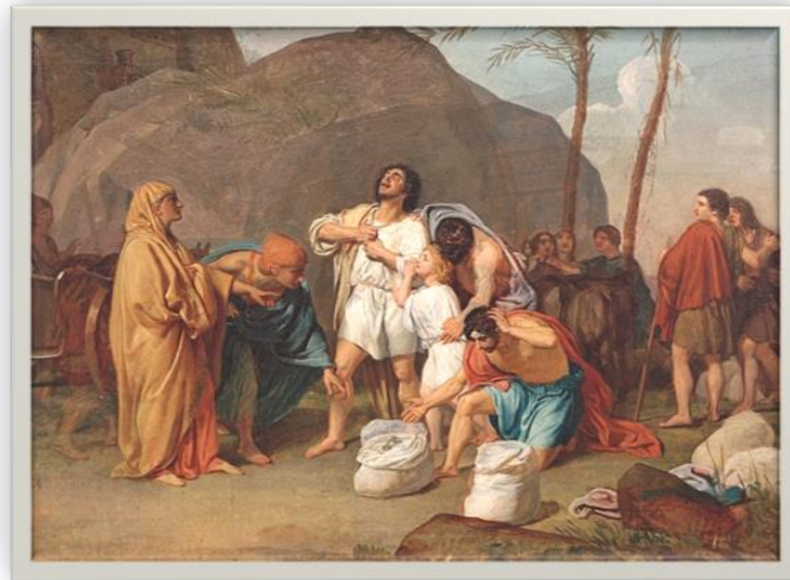
«Братья Иосифа находят чашу в мешке Вениамина» (1831-1833)