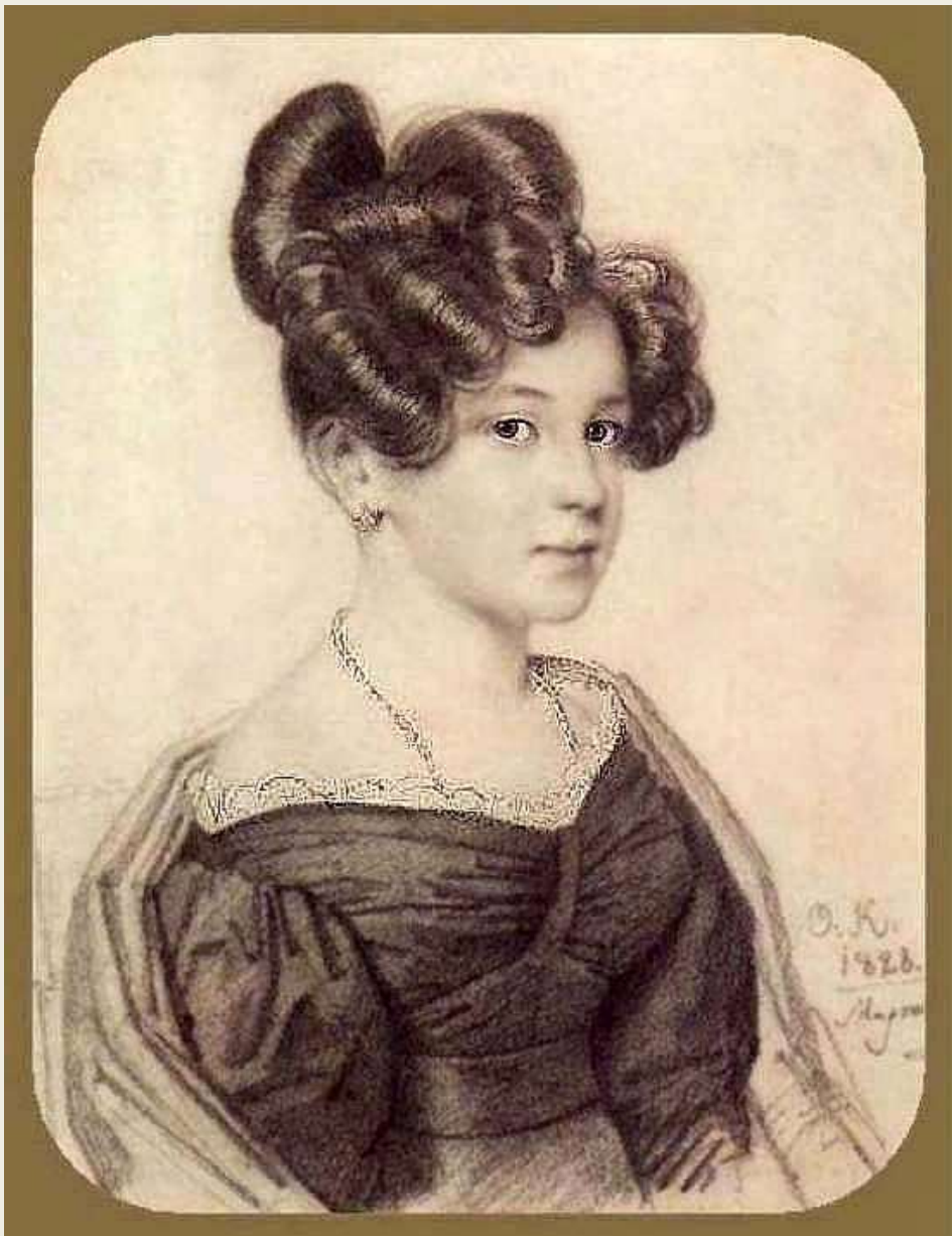
Портрет Анны Алексеевны Олениной