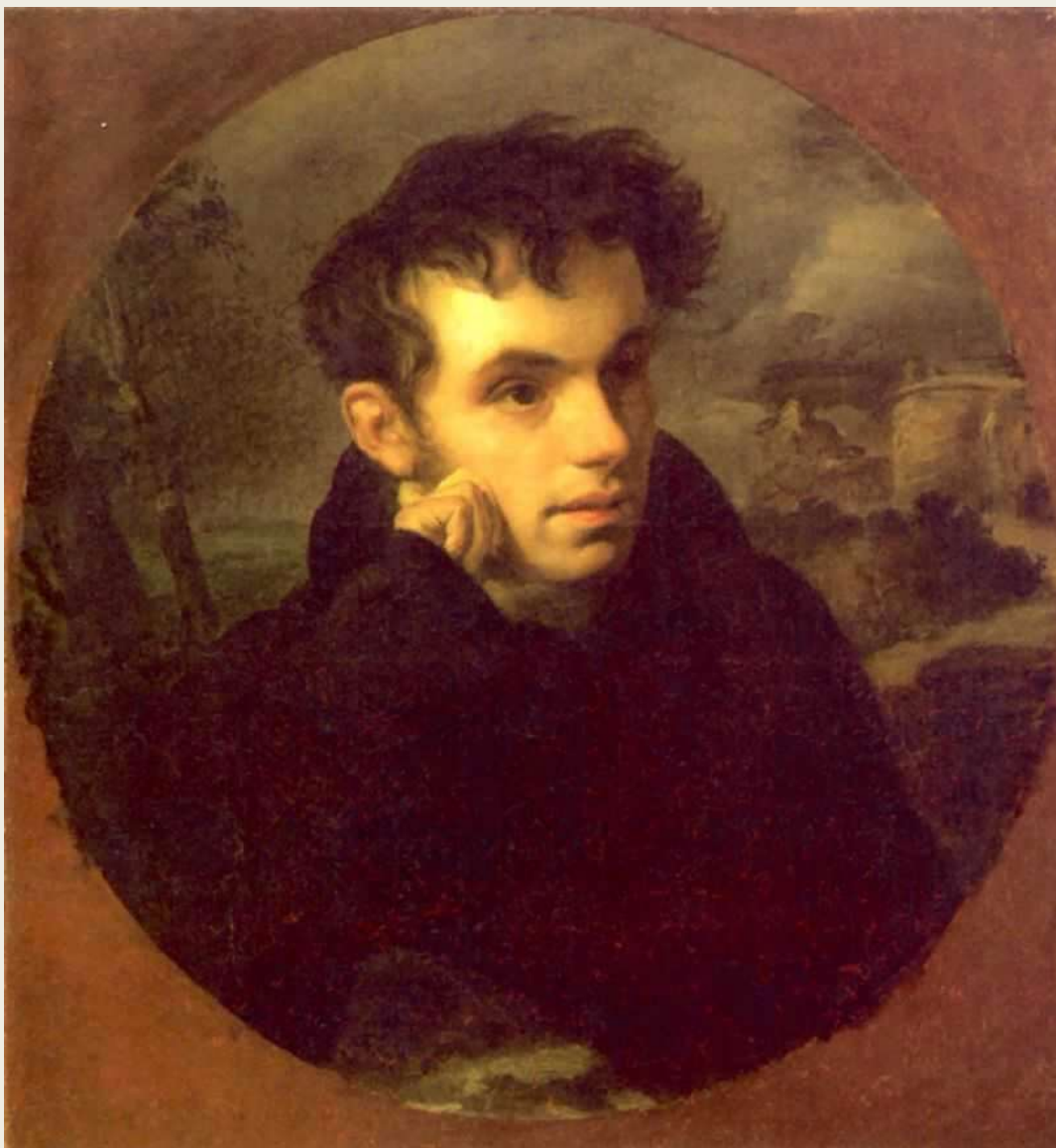
Портрет В.А. Жуковского, 1816