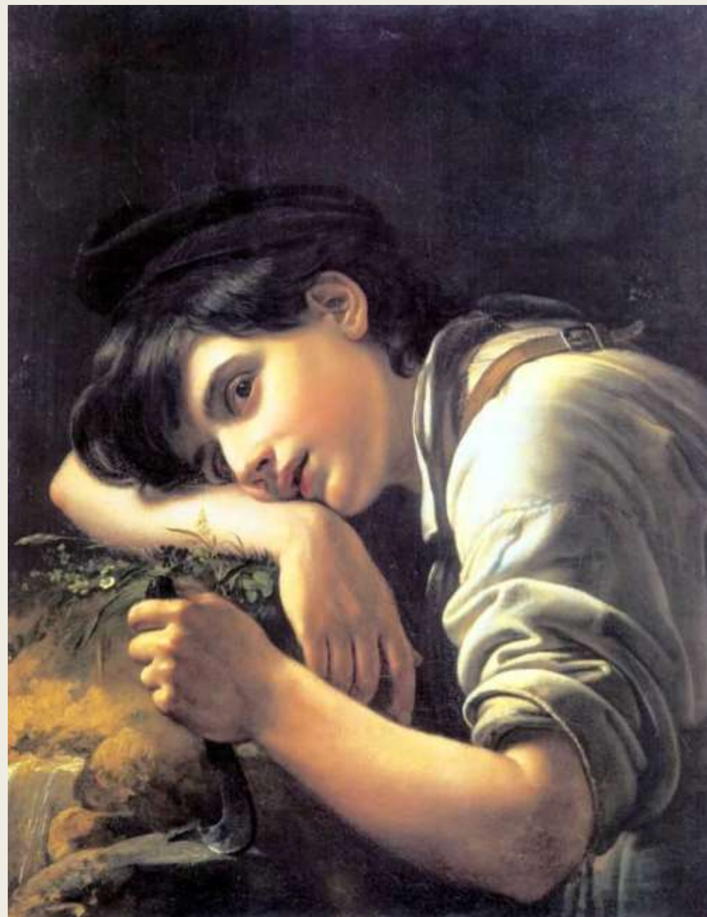
Молодой садовник, 1817