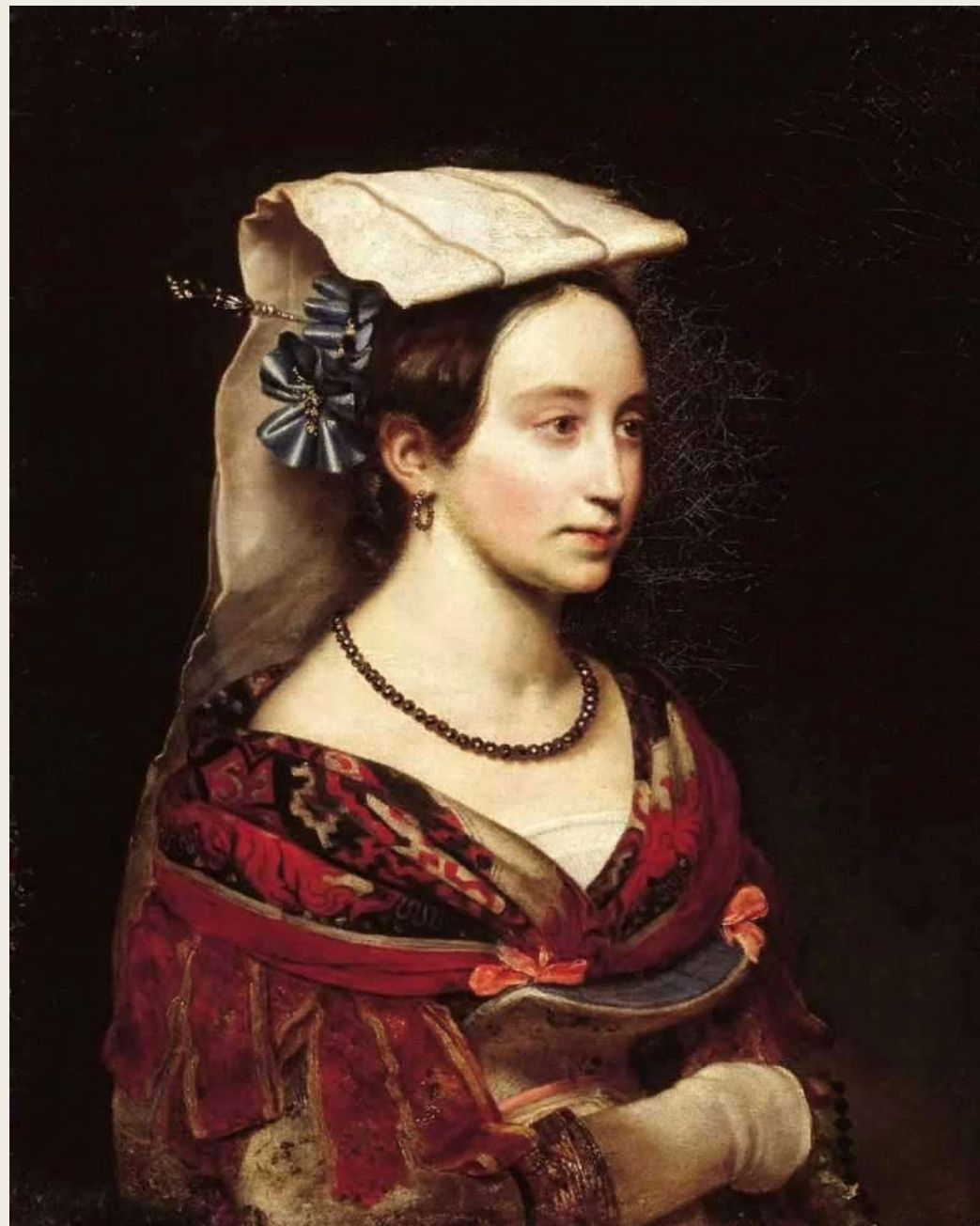
Портрет А.О.Смирновой, 1830