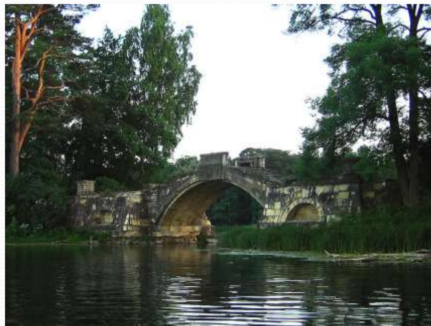
Горбатый мост. 1800.