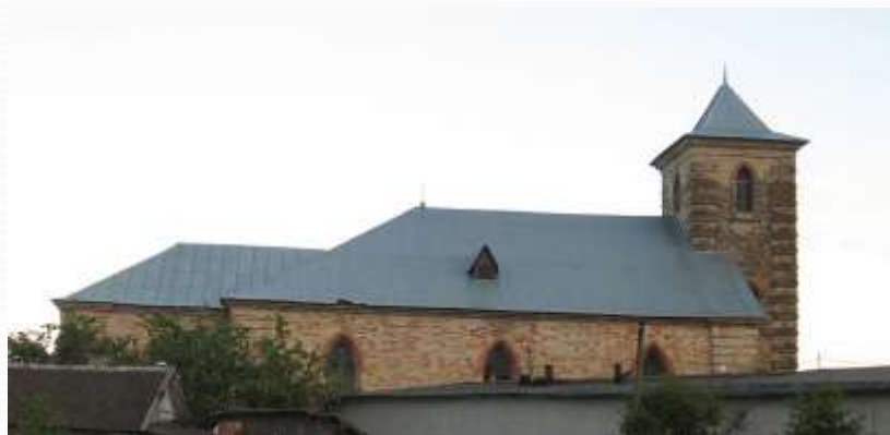
Лютеранская церковь Святого Петра (1799 – 1800 гг.)