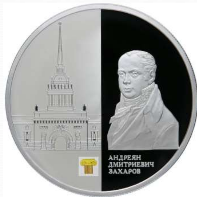
Памятная монета Банка России (2012)