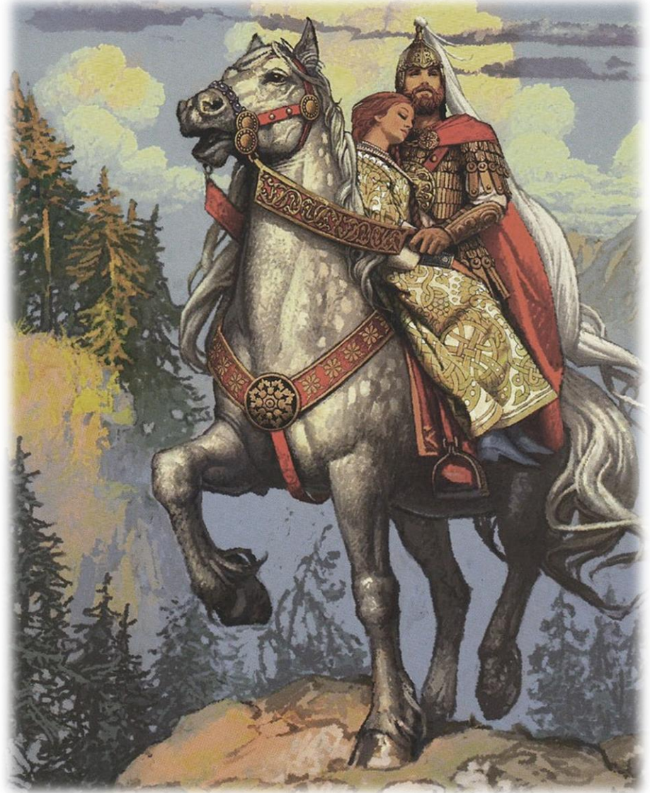
«Руслан и Людмила»

Вольнолюбивые мотивы усиливаются в лирике Пушкина. Появляются и «южные» поэмы, героями которых становятся сильные и ищущие личности, находящиеся в разладе с обществом.