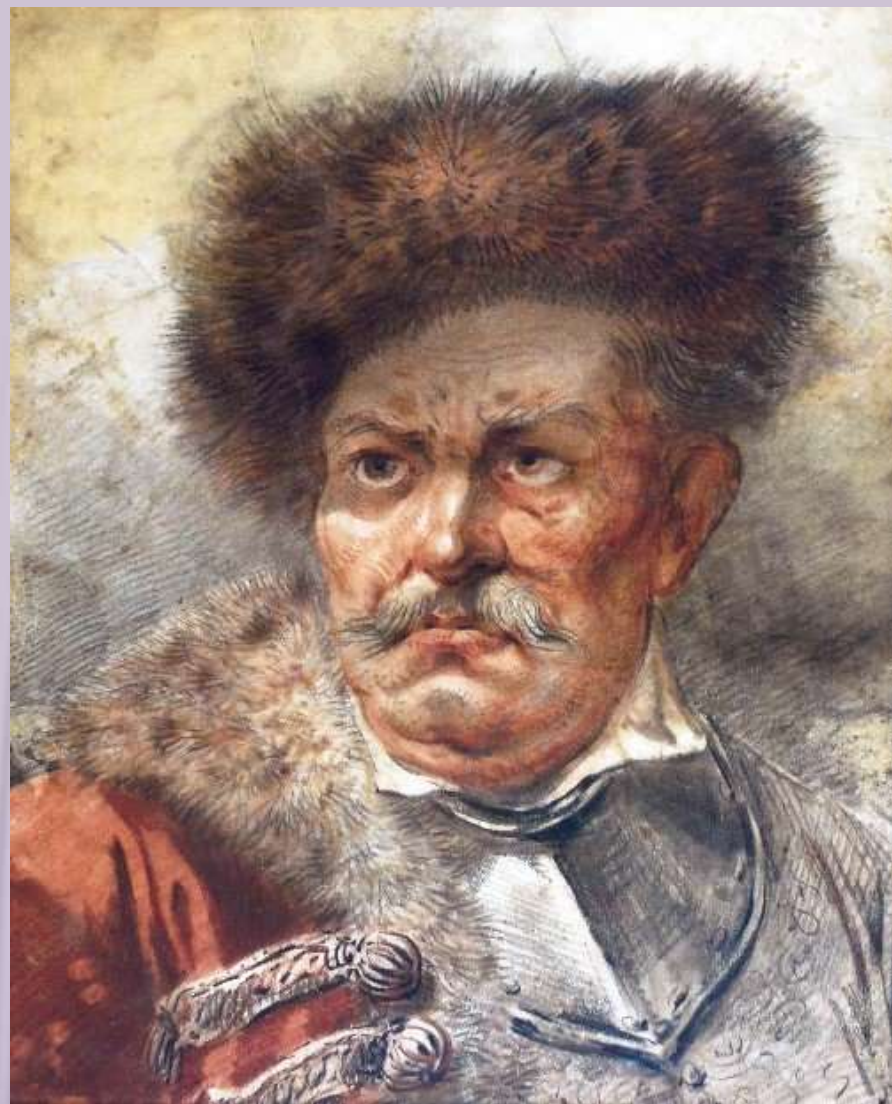
Орловский А.О. Портрет польского дворянина