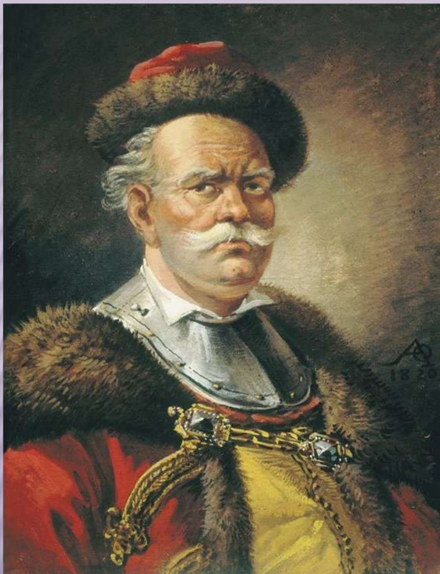
Орловский А.О. Портрет польского шляхтича .1820