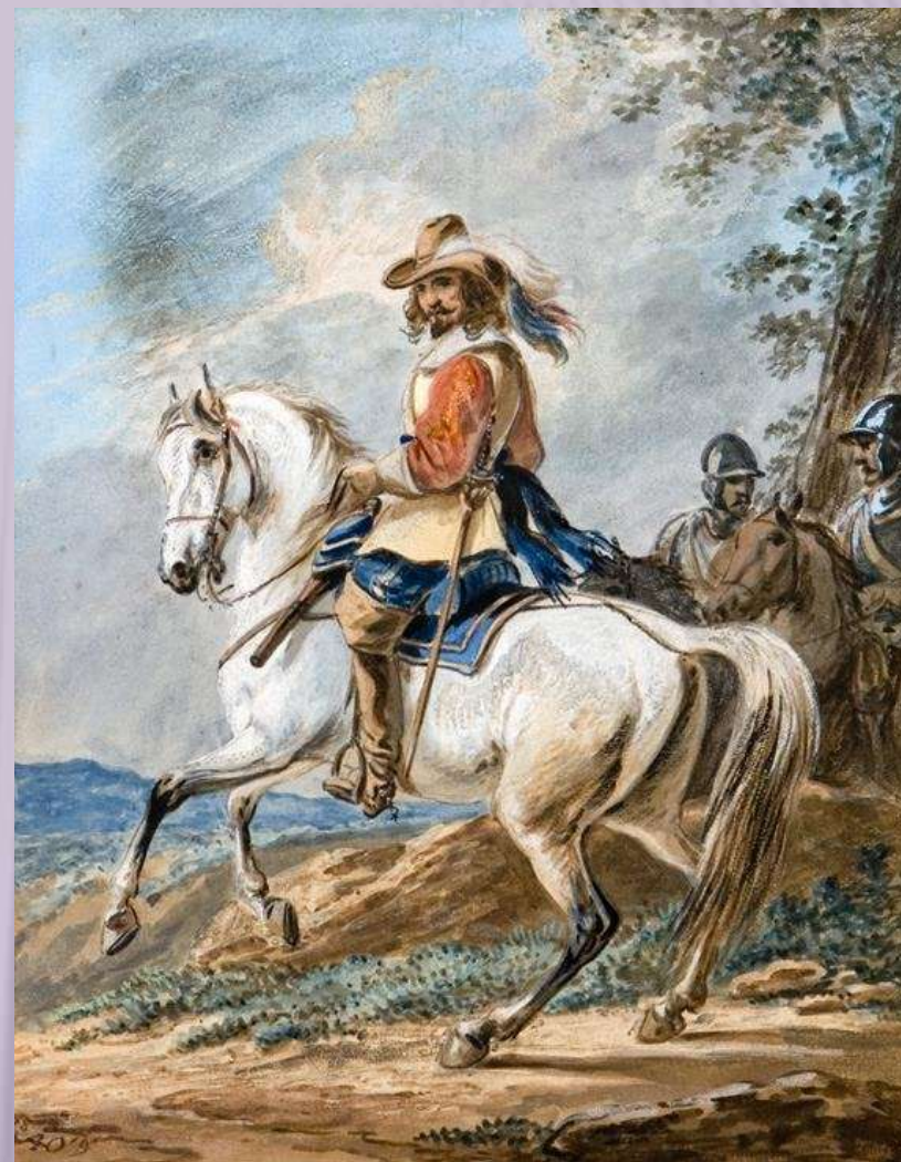
Орловский А.О. Всадник. 1819