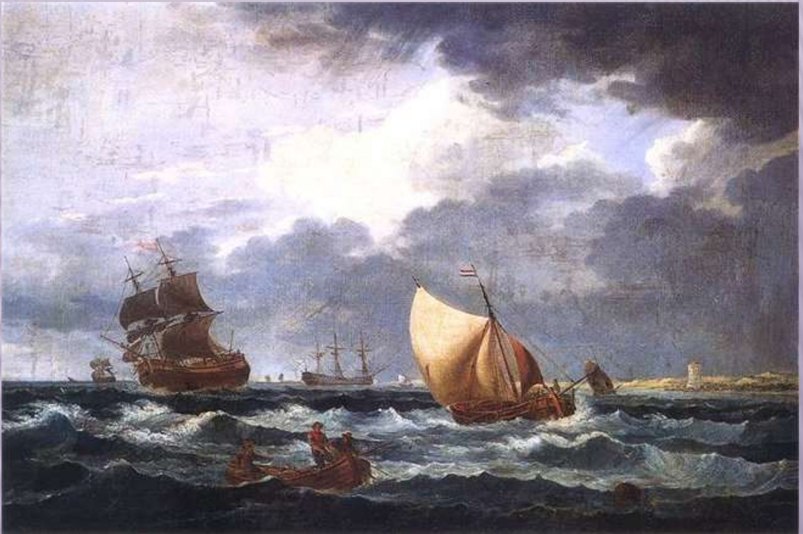
Орловский А.О. Морской вид