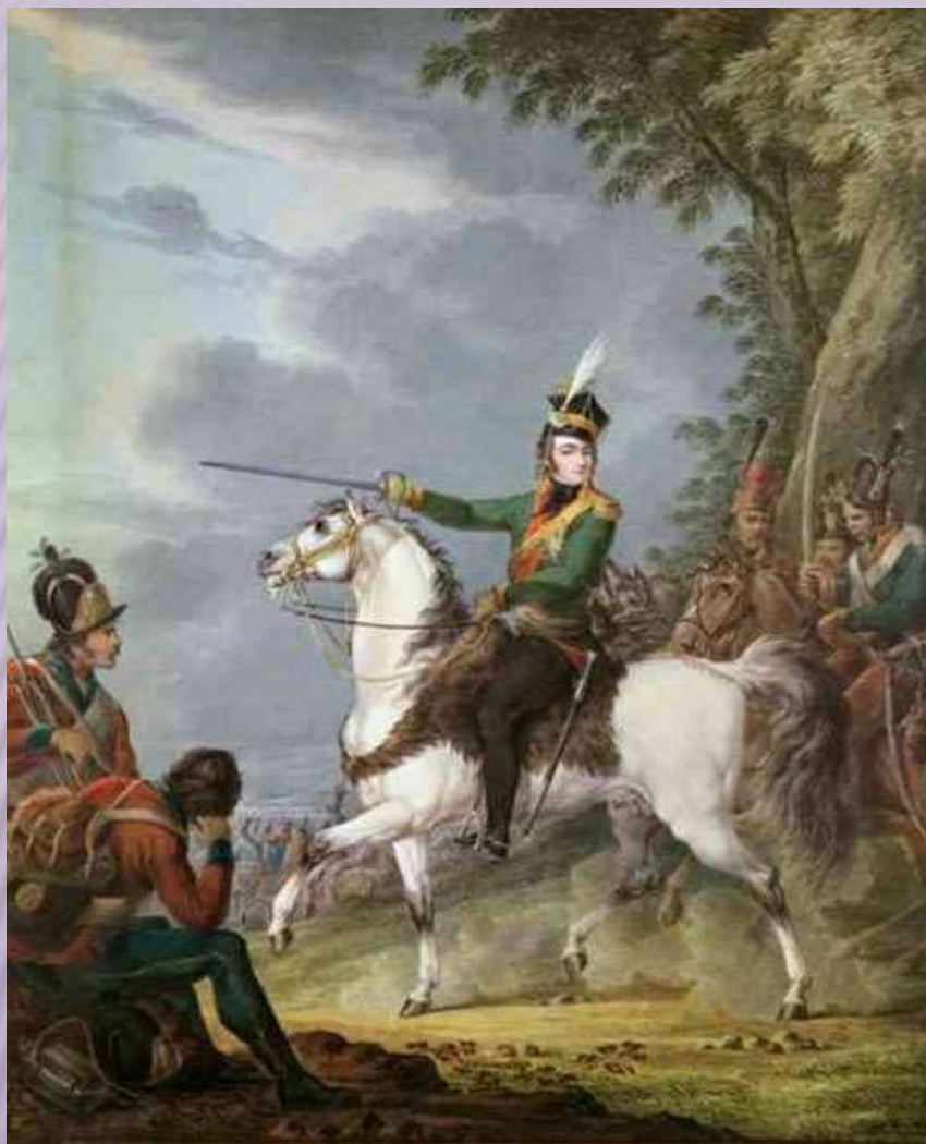
Князь Юзеф Понятовский