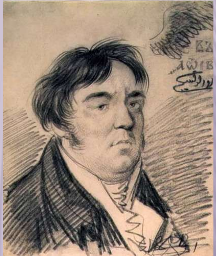
Портрет баснописца Крылова