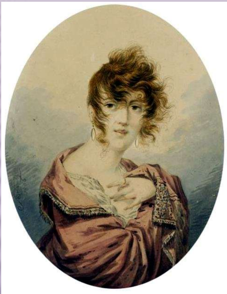
Орловский А.О. Портрет молодой дамы