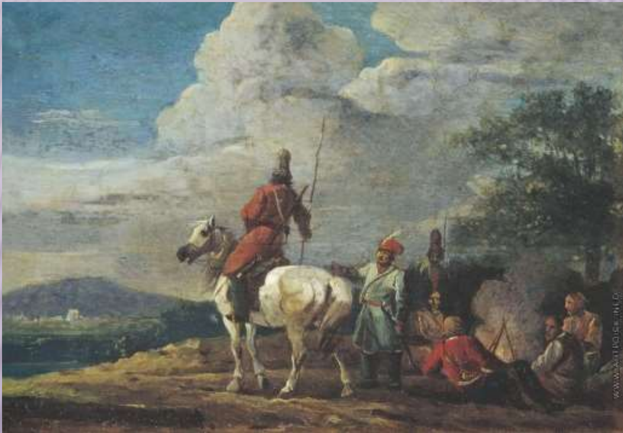
Ночной бивуак казаков.1809.

В 1809 г. за картину "Ночной бивуак казаков" Орловский получил звание академика батальной живописи "как знаменитый художник, труды которого давно известны Академии".