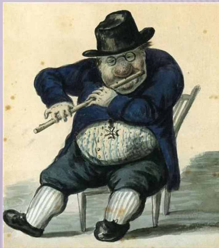
Орловский А.О. Портреты-карикатуры на архитектора Джакомо Кваренги .1811