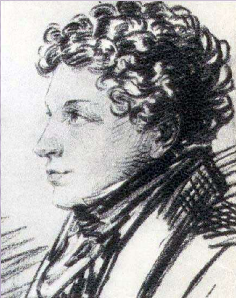
Орловский А.О. Портрет Левушки Пушкина. 1822