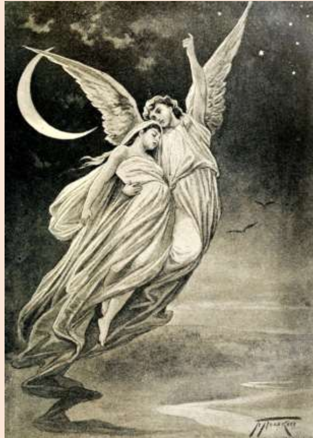
Художник В.А.Поляков «Ангел»