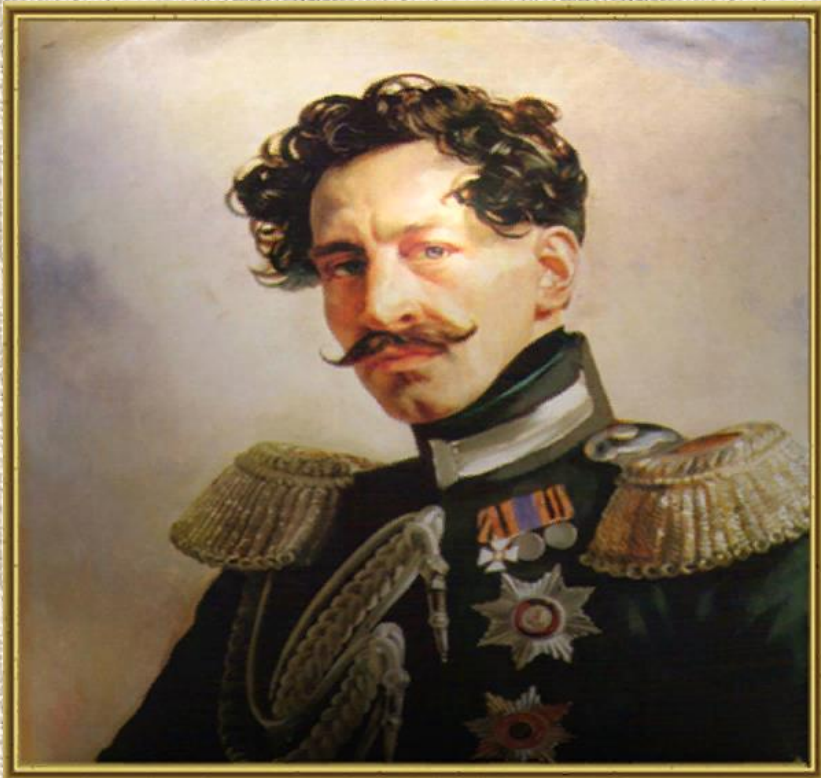
ПОРТРЕТ В.В. ПЕРОВСКОГО. 1837.