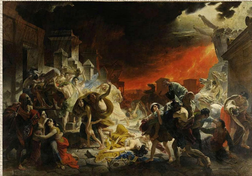
ПОСЛЕДНИЙ ДЕНЬ ПОМПЕИ (1833)

Картина воссоздает гибель античного города Помпея при извержении вулкана Везувий. Сложнейший пейзажный фон, многофигурная композиция потребовали напряжения физической и творческой энергии. Успех картины объясняется бурным драматизмом сцены, блеском и яркостью красок, композиционным размахом, скульптурной четкостью и выразительностью форм. В картине преобладают благородство и любовь. На произведении Брюллова лежит яркий отпечаток влияния романтизма. Это видно и в выборе темы, и в огненном колорите картины. Но с другой стороны, здесь видно еще и влияние классицизма, которому всегда был верен Брюллов — фигуры людей очень напоминают совершенные античные скульптуры.