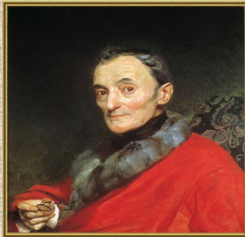
ПОРТРЕТ АРХЕОЛОГА М. ЛАНЧИ. 1851. ФРАГМЕНТ.