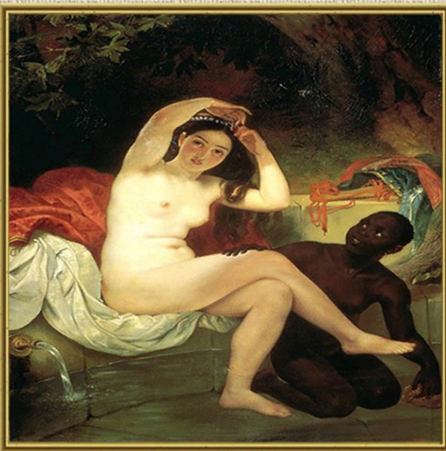
Вирсавия. 1832. Холст, масло

Сюжеты многих его картин навеяны итальянскими мотивами. Брюллову принадлежат полотна и на историческую, и на мифологическую темы, и на бытовые сюжеты. Писал также картины-иллюстрации к литературным произведениям и очень много портретов.