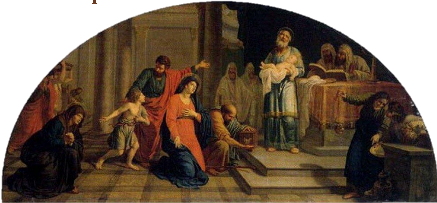
"Сретение Господне", 1800-е для иконостаса Казанского собора