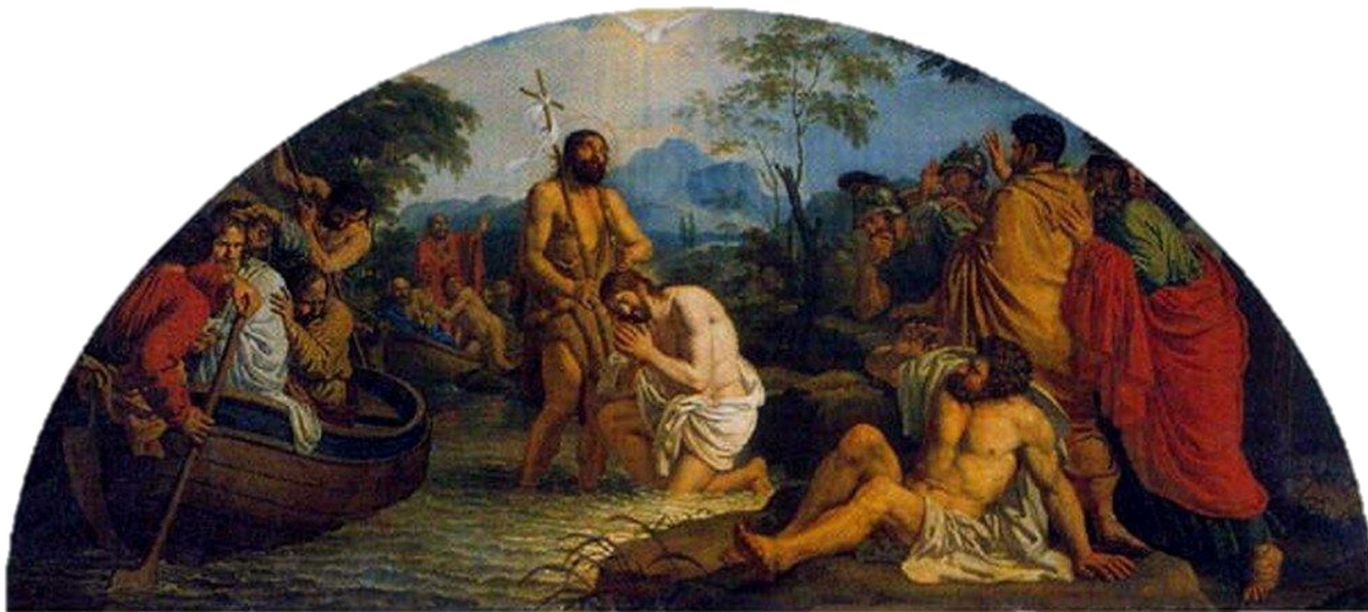
"Крещение Спасителя", 1800-е для иконостаса Казанского собора