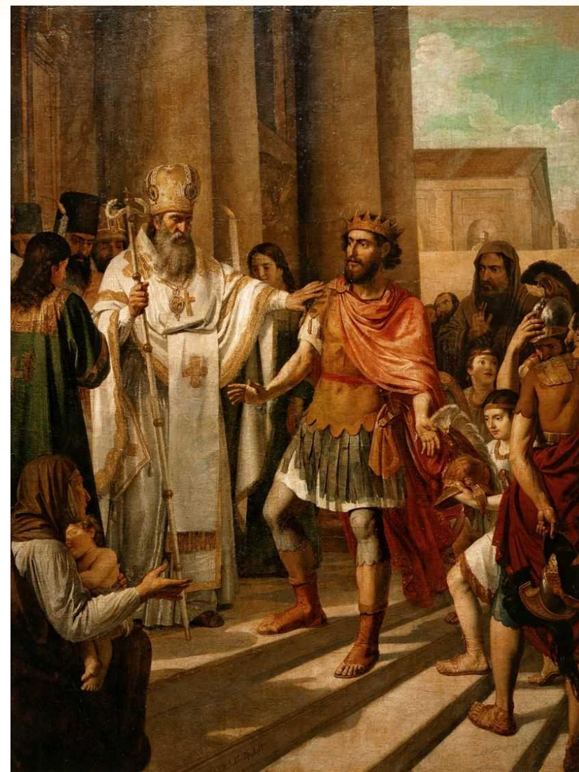
Крещение князя Владимира в Корсуни. 1829