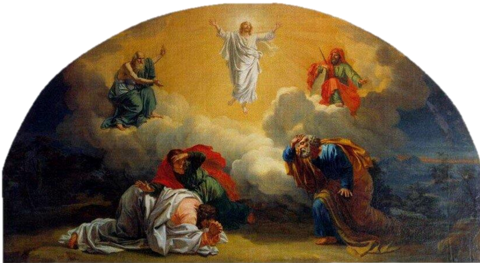
"Преображение" , между 1807 и 1809