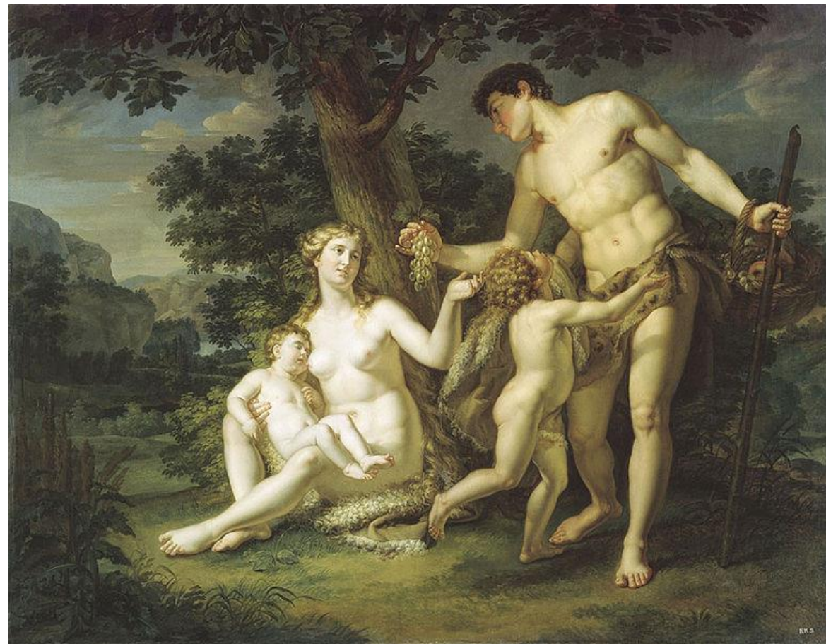
Адам и Ева с детьми под деревом. 1803