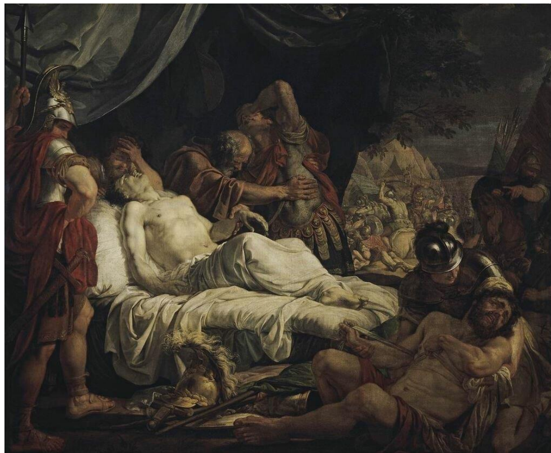
"Смерть Пелопида", 1805-1806

«Иванов берет сюжет из истории Древней Греции. Пелопид , военачальник из города Фивы, отстаивал независимость Фив от Спарты, был одним из организаторов демократического переворота в городе. Погиб в битве при Киноскефалах, защищая города Фессалии от тирана Александра из Фер. В картине представлен кульминационный момент события. В центре, на ложе, – умирающий герой, окруженный соратниками, в глубине – продолжается сражение».