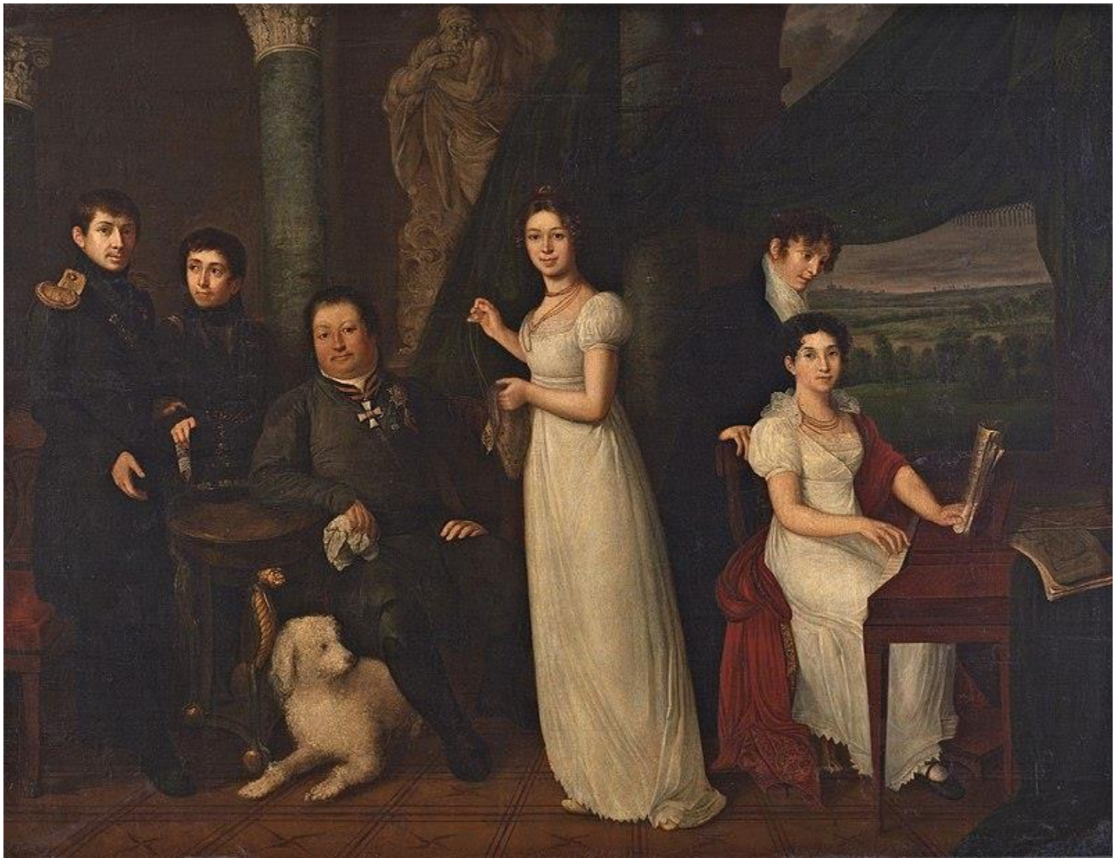
Семейный портрет графов Морковых, 1813 г.