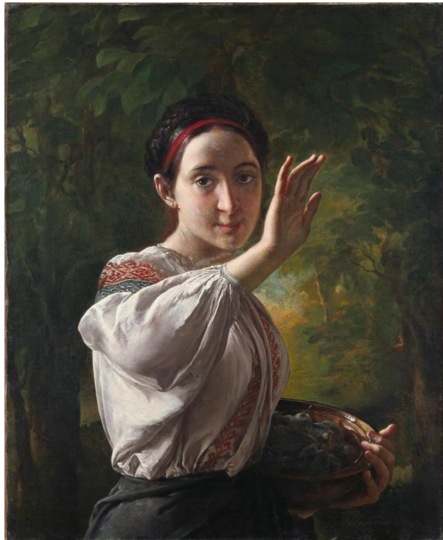
Девушка с Подолья. 1821