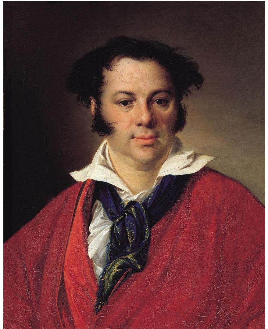
Константин Георгиевич Равич. 1823