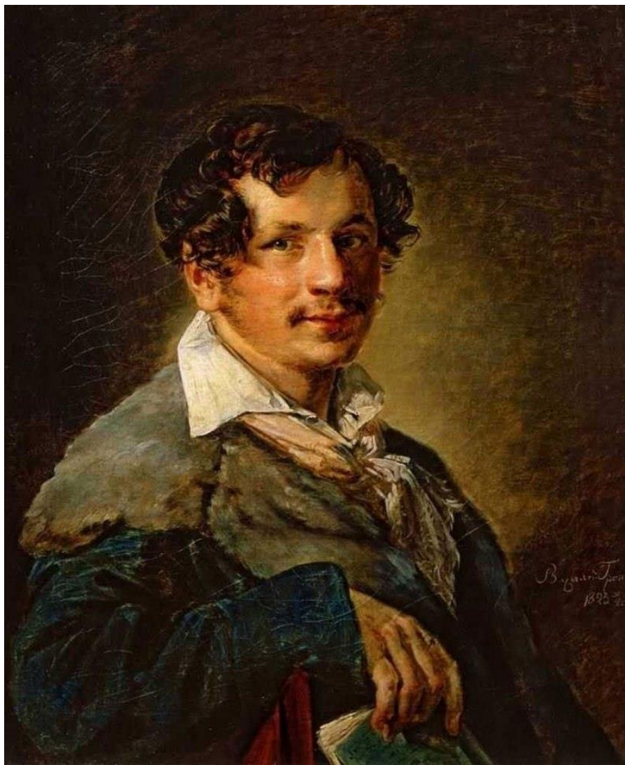
Портрет Петра Булахова. 1823. Государственная Третьяковская галерея