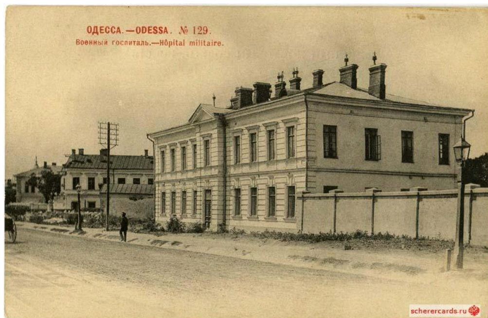
Военный госпиталь в Одессе. 1821г.

С 1800 года Тома де Томон начинает преподавать в Академии художеств, а с 1811 года – в Институте корпуса инженеров путей сообщения.