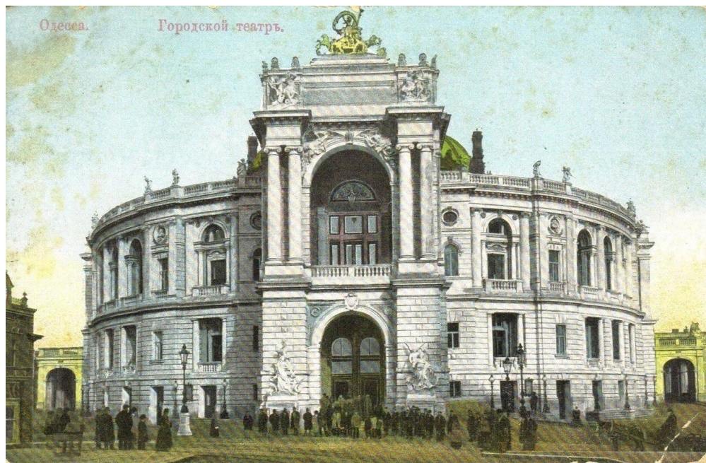
Старый Одесский оперный театр. 1809г.

В 1780-х годах он проходил обучение в Парижской академии, по окончании получил большую римскую премию. На эти деньги Тома де Томон отправляется в Италию для дальнейшего обучения.