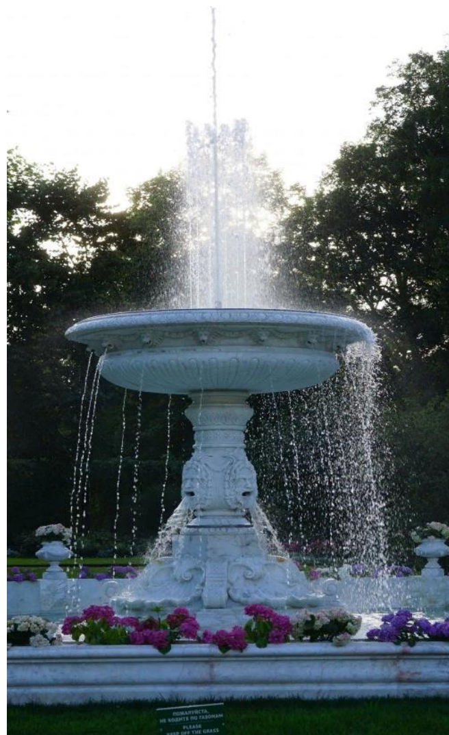
Фонтаны вдоль дороги из Петербурга в Царское Село.