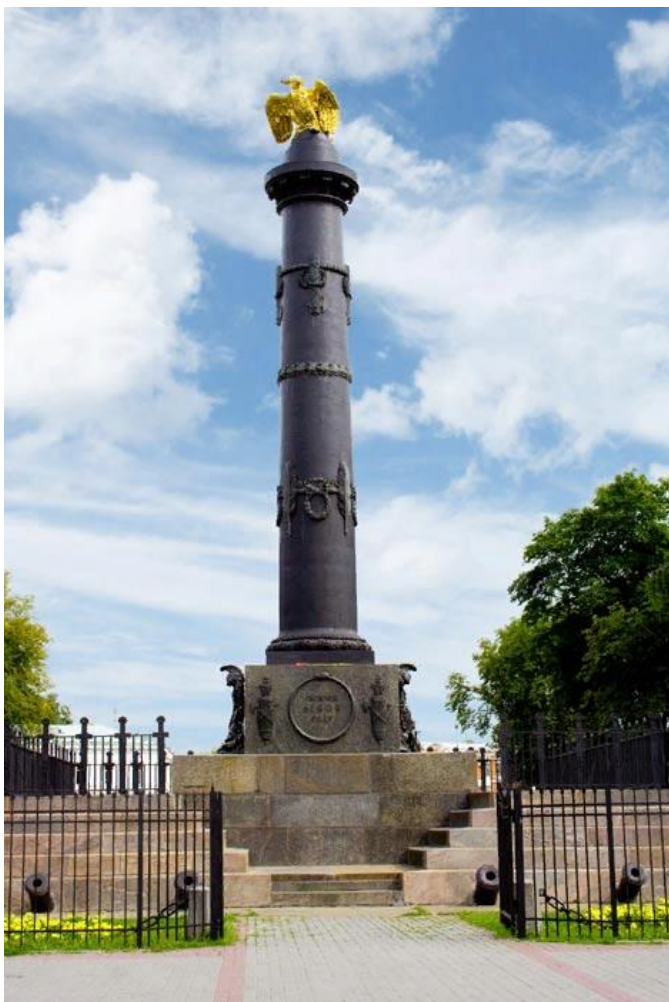
Монумент Славы в Полтаве