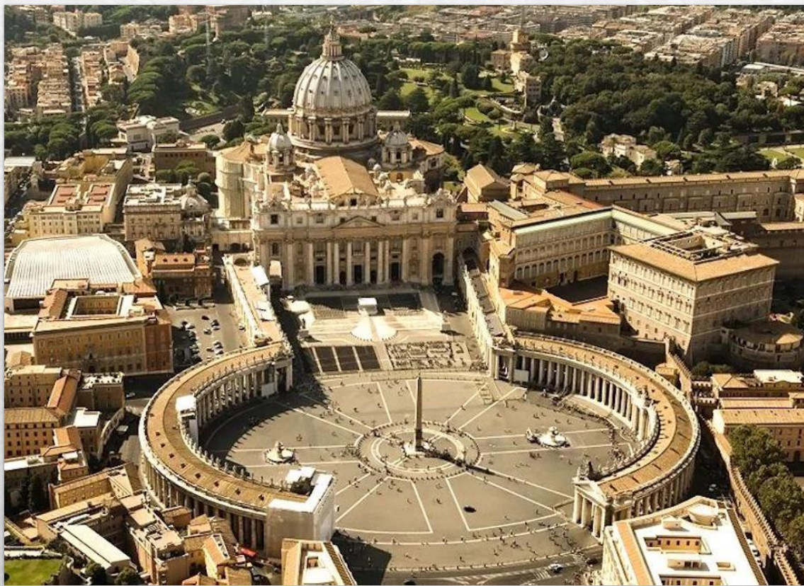
Собор Святого Петра в Риме (1506)