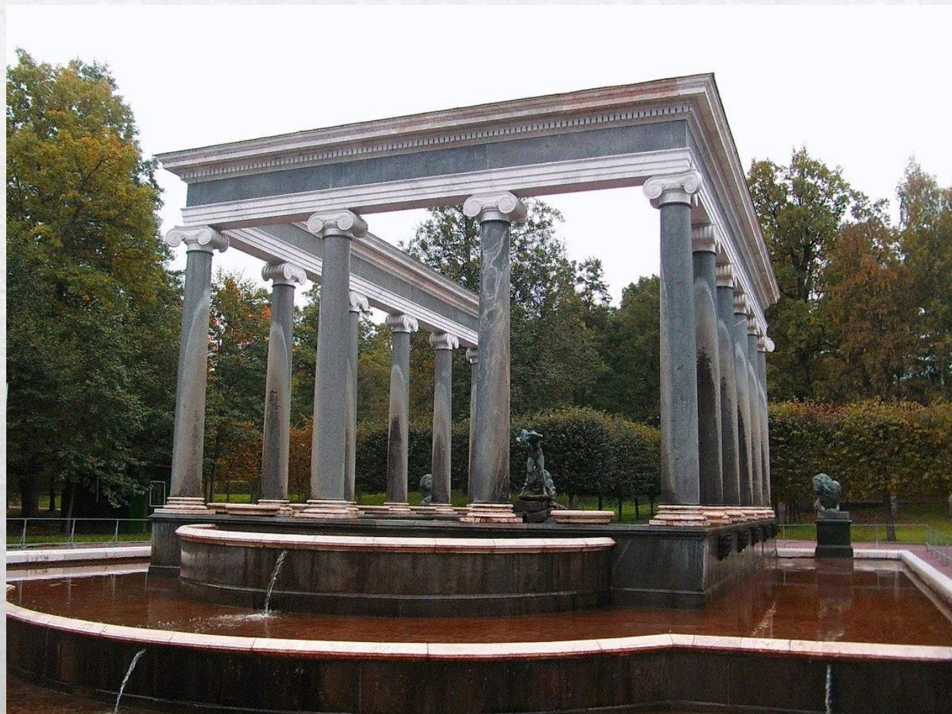
«Львиный каскад» в Петергофе (1799-1801)