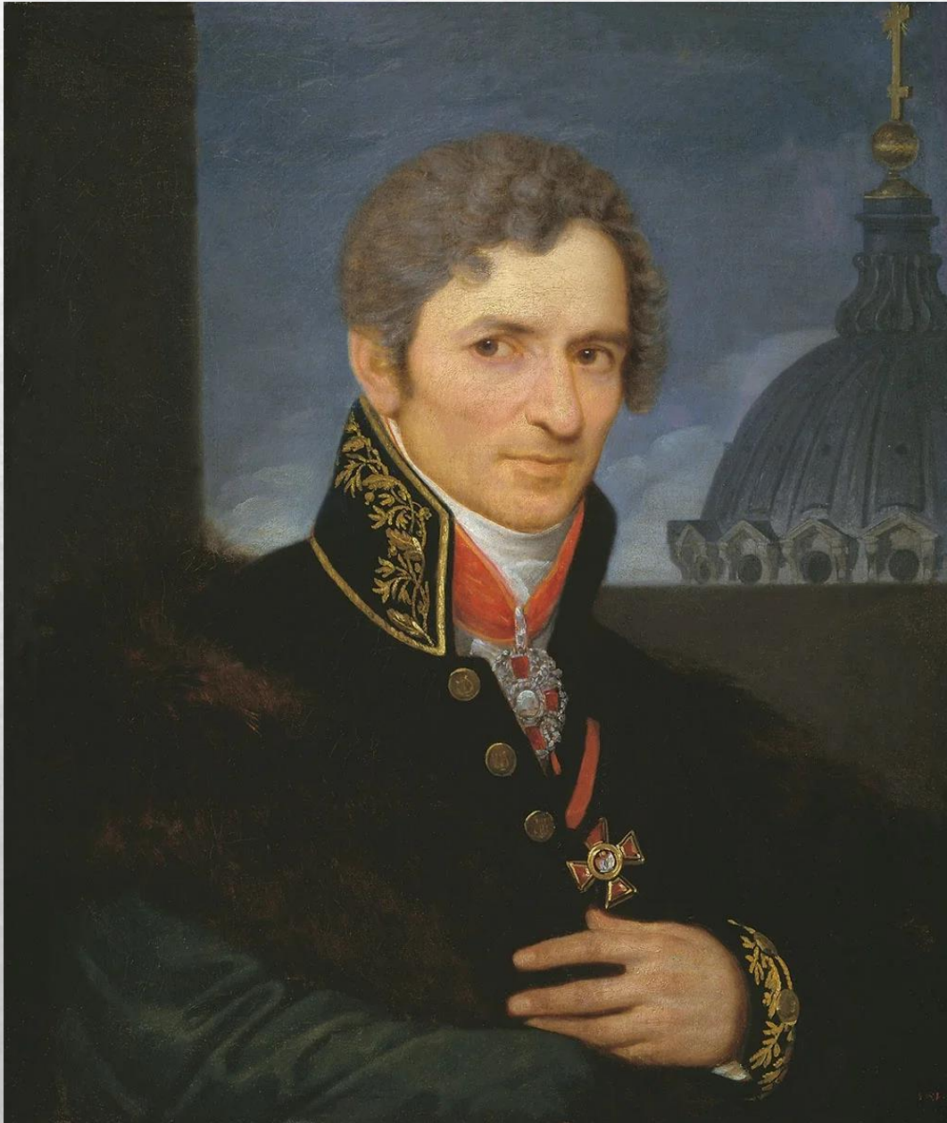
Воронихин Андрей Никифорович (1759-1814)