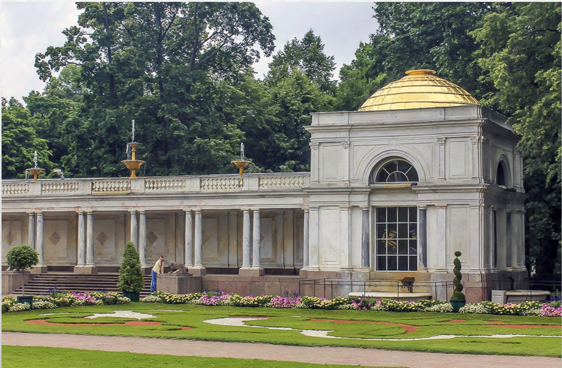
Колоннады в Петергофе (1800-1803)