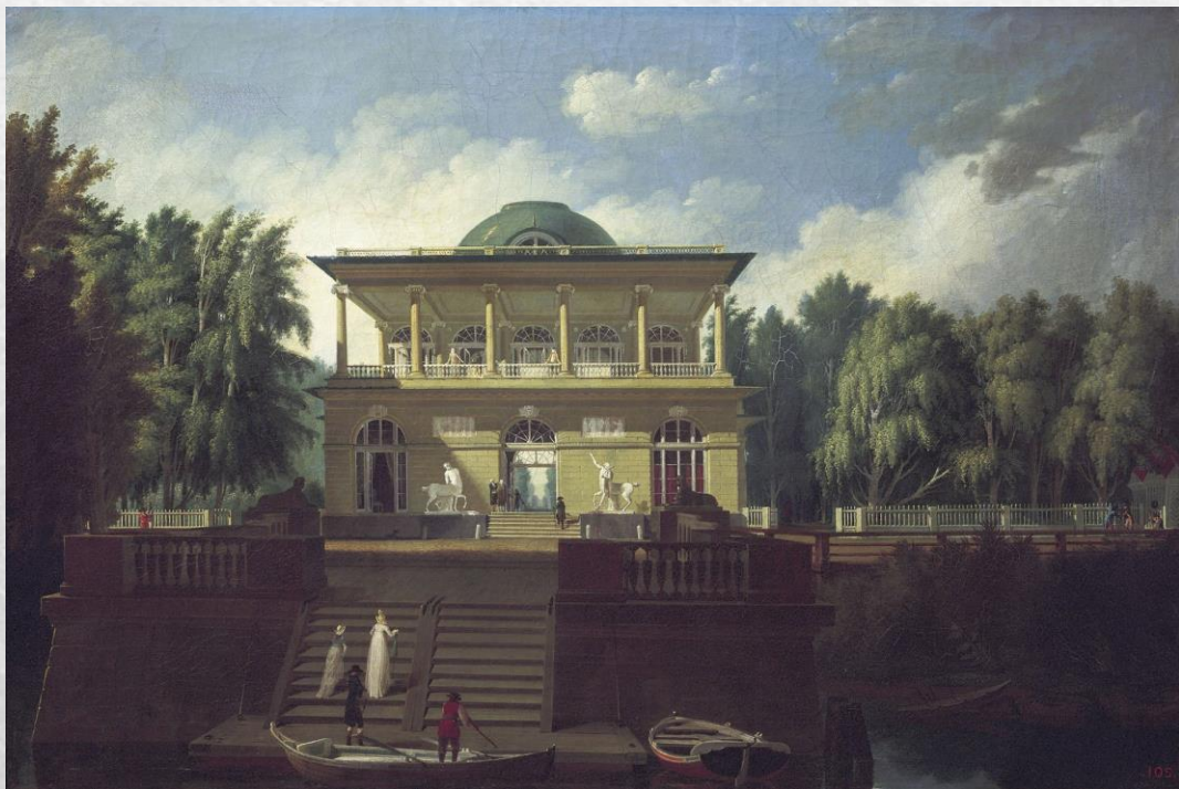
Вид Строгановской дачи (Русский музей, 1797)

Лишь немногие здания Воронихина сохранились до наших дней. Но два его главных шедевра до сих пор украшают Петербург.