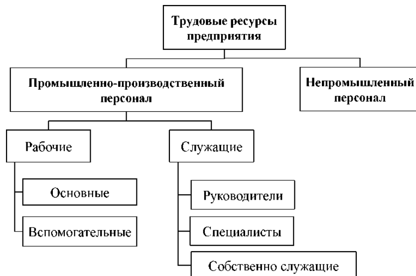
Рис. 8.1 - Структура кадров предприятия

В зависимости от выполняемых функций и степени участия в производственной деятельности все работники делятся на промышленно-производственный персонал и непромышленный персонал (рис. 1).