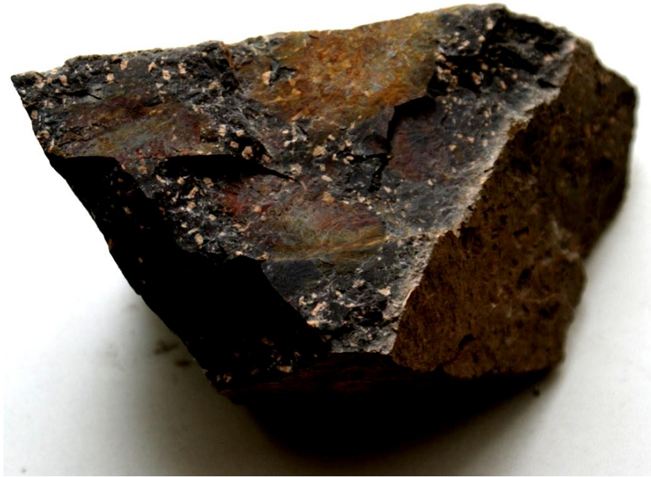
Рис. 1.4. Трахит: на фоне стекловатой массы вкрапленники ортоклаза (порфировая структура)

Группа диорита - андезита. В составе диоритов преобладают средние плагиоклазы и роговая обманка, присутствуют пироксены, кварц (до 1 - 3 %) и биотит. Темноцветных минералов около 25 %. Окраска серая, темно-серая или зеленовато-серая. Структура полнокристаллическая, мелкозернистая (рис.1.5); текстура массивная, пятнистая, полосчатая. Залегают в форме штоков, даек, жил. Андезиты - излившиеся аналоги диоритов, имеют серую, темно - серую до черной окраску. Структура порфировая: на фоне основной стекловатой или полукристаллической массы выделяются мелкие, иногда крупные кристаллы и зерна белого или серого плагиоклаза (рис.1.6), редко авгита, роговой обманки и биотита. Текстура плотная, иногда пористая. Формы залегания разнообразны: покровы, потоки, купола, дайки. Андезиты развиты на Камчатке, в Приморье, в Алтае, Урале. Ими сложены потухшие вулканы Казбек и Эльбрус.