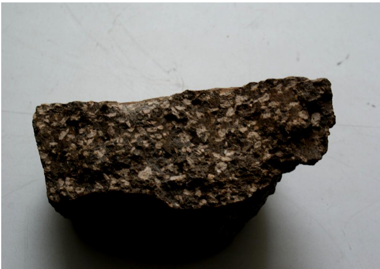
Рис. 1.6. Андезит: на фоне стекла порфировые выделения плагиоклаза