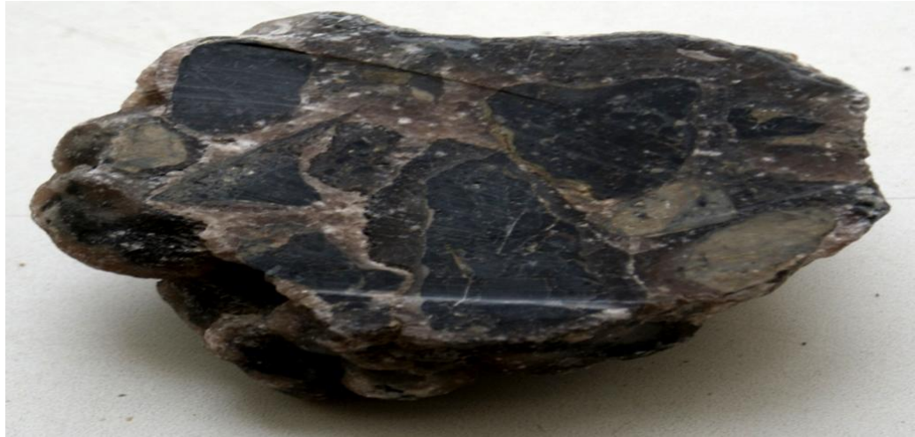
Рис. 3.3. Тектоническая брекчия: угловатые обломки алевролитов сцементированы флюоритом.

Структуры метаморфических пород определяются формой, размерами и взаимоотношением минералов (индивидов в виде отдельных зерен, кристаллов).