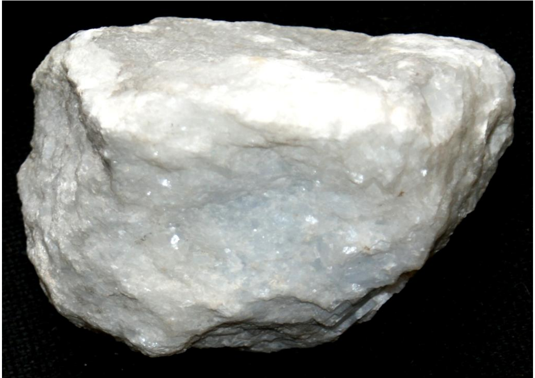
Рис.3.5. Мрамор массивной текстуры, зернистой структуры

Чистые разновидности мраморов имеют белый цвет, примеси придают различную окраску - серую, голубую, розовую и др. Мраморы, содержащие примеси цветных минералов (гранаты, пироксены, амфиболы и др.) называются кальцифирами . Мраморы и кальцифиры бурно реагируют с соляной кислотой. Известно 14 разновидностей мраморов [30].