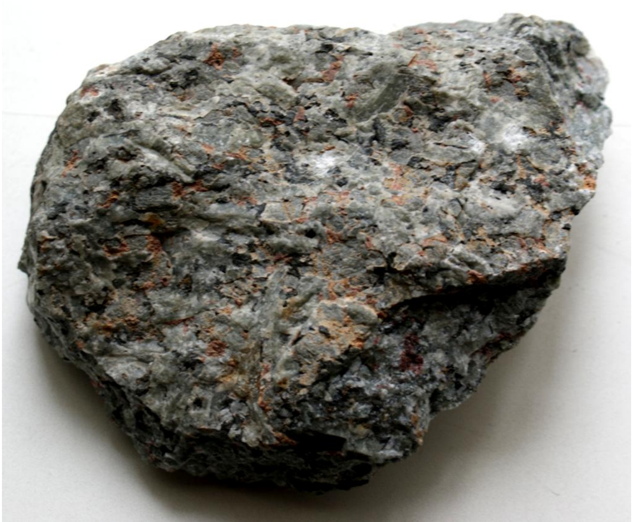
Рис. 1.9. Нефелиновый сиенит