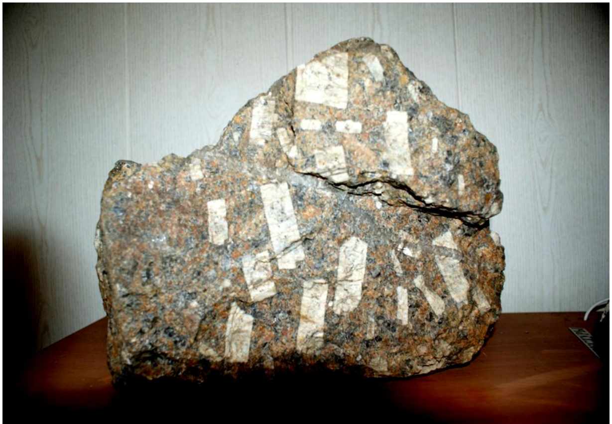
Рис.1.2. Гранит порфировидной структуры: на фоне мелкозернистой основной массы крупные вкрапленники ортоклаза.

распространены во всех горных областях, возраст гранитов от докембрийского до мезозоя. Липариты (риолиты), являющиеся эффузивным (излившимся) аналогом гранитов имеют белесовато - серый, желтоватый или розоватый цвет, массивную, плотную, иногда пористую или флюидальную текстуру и порфировую структуру. На фоне стекла порфировые выделения представлены, в основном кварцем, иногда калишпатом или биотитом. Липариты залегают в виде потоков, куполов, лакколлитов, даек, развиты меньше гранитов.