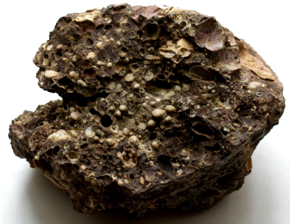
Рис.1.8. Базальт: миндалины кварца и кальцита

Группа дунита - перидотита - пироксенита - пикритового порфира - это ультраосновные беспалевошпатовые породы. Состоят только из цветных минералов: оливина, роговой обманки, пироксенов. Окраска их темно - зеленая, буровато - черная до черной. Второстепенные и акцессорные минералы: хромит, магнетит, ильменит, платиноиды. Породы тяжелые, удельный вес 3 - 3,4. Развиты редко и составляют всего 0,4 % от всей массы магматических пород, встречаются в форме интрузивных тел. Излившиеся аналоги их - пикриты и пикритовые порфиры. По минеральному составу различают дуниты , состоящие из оливина с примесью магнетита и некоторых других рудных минералов, имеющие массивную текстуру, кристаллическую структуру, черный, темно-серый с зеленоватым оттенком цвет; перидотиты , состоящие из оливина (40 - 90 %), пироксенов (10 - 60 %) и роговой обманки (5 - 40 %), имеющие черный и темно-серый с зеленым оттенком цвет, зернистую структуру и массивную текстуру; пироксениты , состоящие из пироксенов, оливина, роговой обманки; пикриты , имеющие массивную, реже флюидално-директивную, миндалекаменную текстуру, темно-бурю, темно-зеленую или почти черную окраску, залегают пикриты в