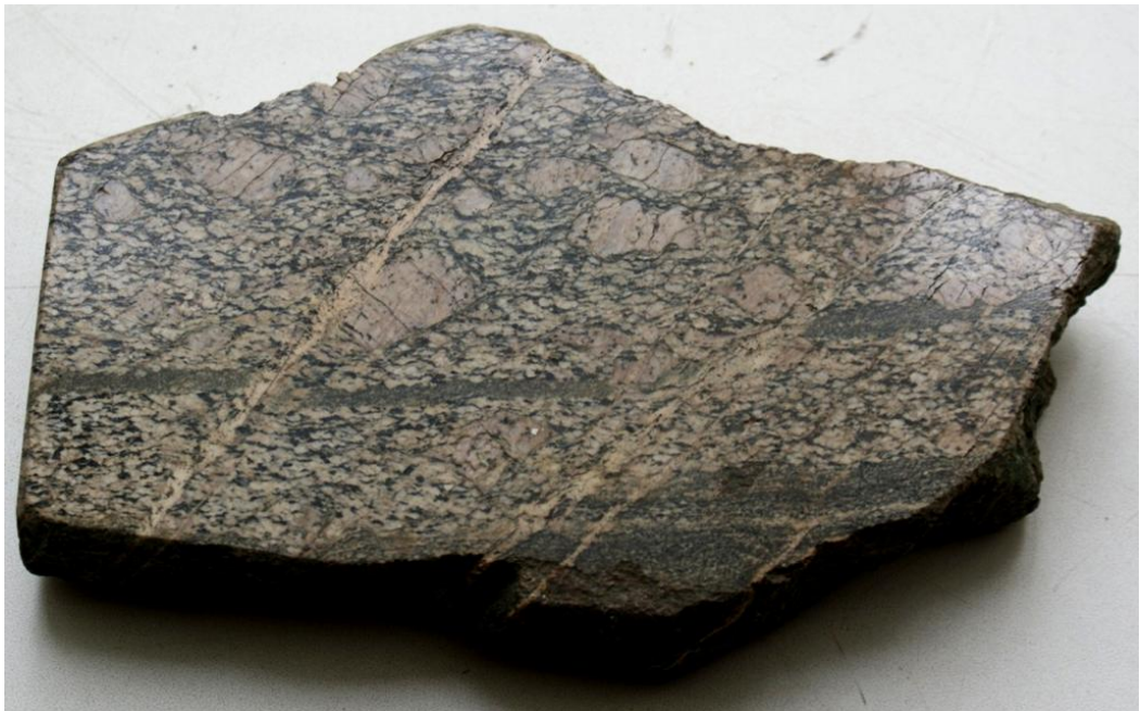
Рис. 3.2. Очковая текстура гнейсо - гранита

Очковая - характеризуется рассеянными в породе более крупных овальных зерен и агрегатов («очками») на фоне сланцеватой основной массы породы. (Рис.3.2.).