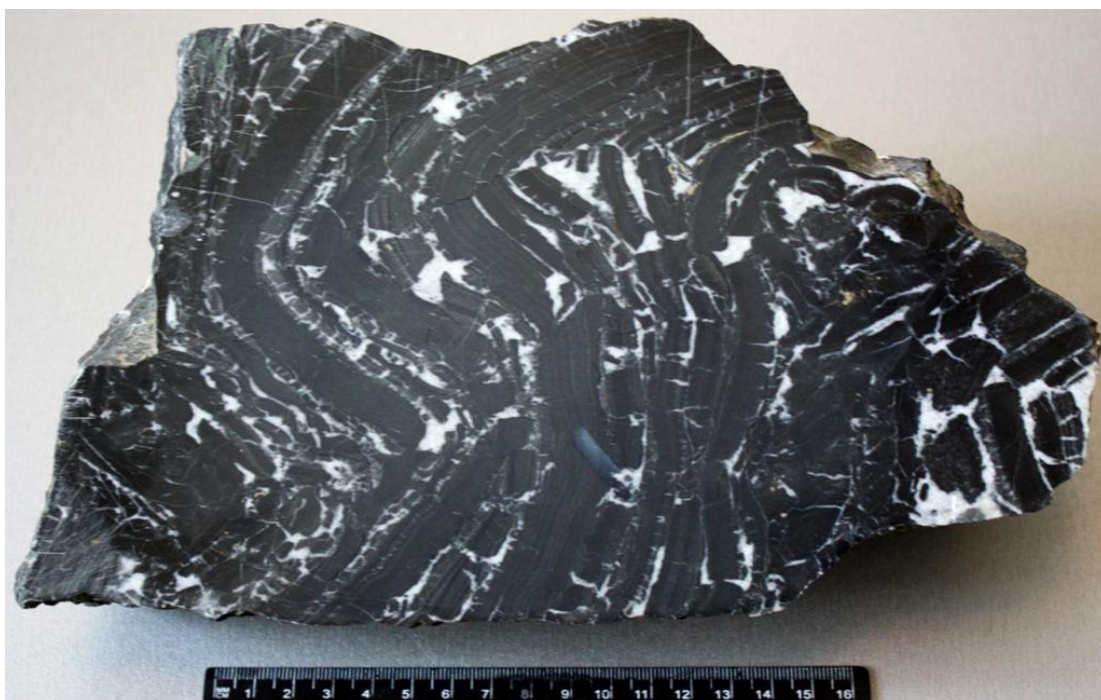
Рис.3.4.. Плейчатая текстура в железистом кварците

Кварциты образуются при метаморфизме кварцевых песков и песчаников, а также кремнистых (трепелы, опоки) и других богатых кремнеземом пород. Представляют собой зернистые породы, состоящие почти полностью из зерен кварца; породы очень крепкие с раковистым изломом, отдельные зерна в которых часто неразличимы. Цвет пород различный, преимущественно серый. Структура полнокристаллическая, обычно мелкозернистая, текстура массивная, иногда слабо выраженная сланцеватая, в железистых кварцитах нередко плейчатая (рис.3.4). Известно 25 разновидностей кварцитов [30].