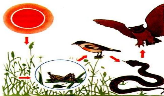
Рисунок 1. Трофическая цепь.

Используя рисунок, рассчитайте величину биомассы продуцентов, если средняя масса филина составляет 2,7 кг, в экосистеме насчитывается 1300 особей.