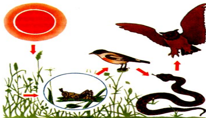
Рисунок 1. Трофическая цепь.

Используя рисунок, рассчитайте величину биомассы продуцентов, если средняя масса филина составляет 2,7 кг, в экосистеме насчитывается 1300 особей.