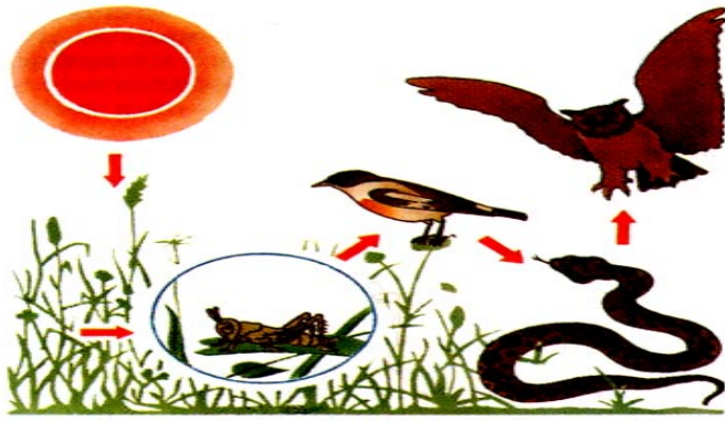
Рисунок 1. Трофическая цепь.

Используя рисунок, рассчитайте величину биомассы продуцентов, если средняя масса филина составляет 2,7 кг, в экосистеме насчитывается 1300 особей.