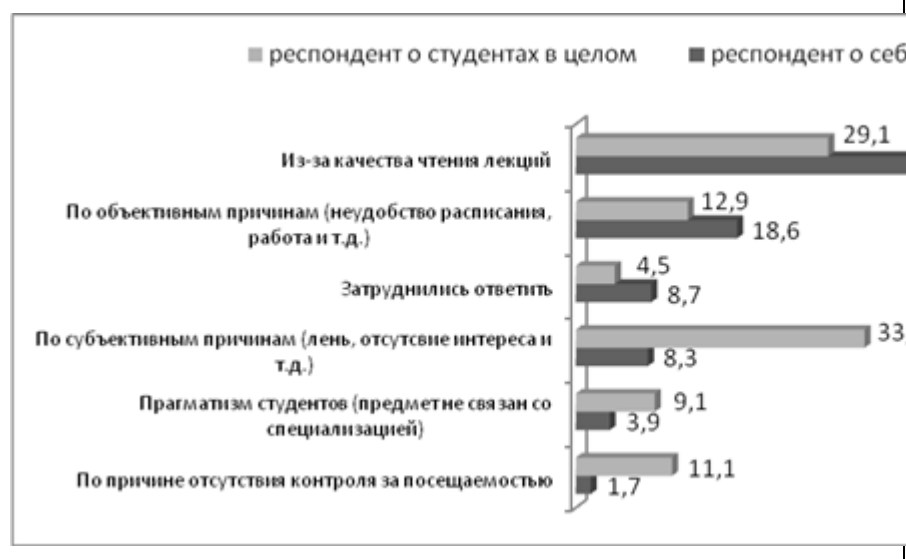
Рис. 2. Причины пропуска лекций, %.

1) Какие инновационные технологии образования наиболее приемлемы при проведении лекционных занятий? 2) Будут ли студенты стараться не пропускать лекции, если посещаемость станет влиять на итоговую оценку по предмету? 3) Какие технические средства и как часто используются лекторами? Влияет ли это на посещение занятий?