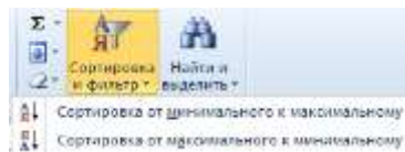
Рис. 2. Кнопка Сортировка и фильтр

После того, как показатели будут упорядочены, проранжируем их, воспользовавшись функцией РАНГ.СР. Для этого в ячейке рядом с первым показателем (G2) нажмем на кнопку Вставить функцию. В открывшемся диалоговом окне в пункте Категория выберите Статистические, а в перечне доступных функций – РАНГ.СР. В диалоговом окне Аргументы функции в строке Число выберите ячейку с первым показателем (F2), в строке Ссылка выделите весь диапазон показателей (от F2 до F27), полученную запись F2:F27 изменим, добавив знаки доллара перед именами столбцов и строк, для того, чтобы диапазон всегда оставался фиксированным и мы могли скопировать эту формулу, в результате запись в строке примет вид $F$2:$F$27. В строке Порядок введите 1 или любое число, кроме 0. В этом случае сортировка рангов в списке будет осуществляться по возрастанию. Итоговый вид диалогового окна представлен на рисунке 3. Выполнив все указанные действия, нажмите на кнопку ОК. После этого в ячейке отобразится значение ранга, равное 1. Скопируем эту формулу для остальных ячеек. В итоге получим ранги для всех показателей (рис. 4).